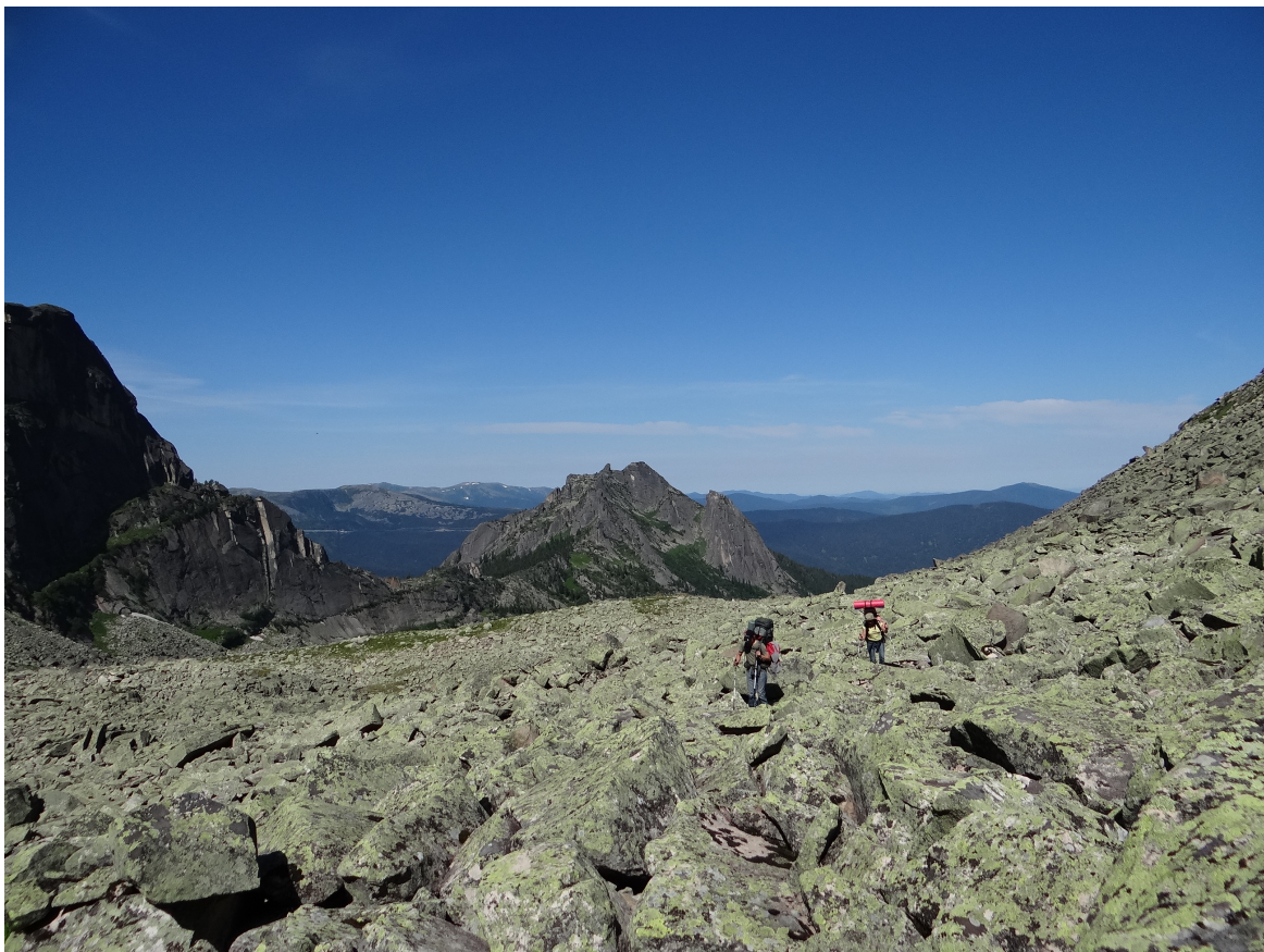
Рис.4 Подъем на перевал НКТ