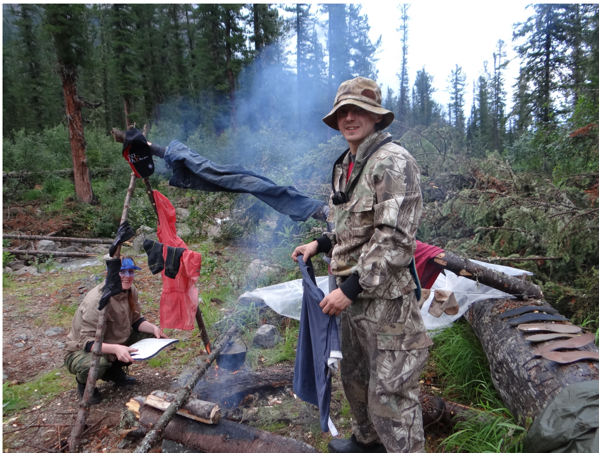
Рис.5 На стоянке Стрелка. Сушимся после сильного дождя.