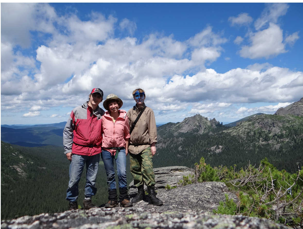
Рис.2 Группа на перевале Спящий Саян