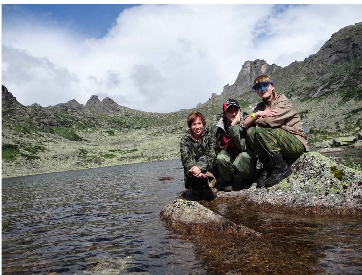
Рис.1 Группа на озере Нижнее Буйбинское