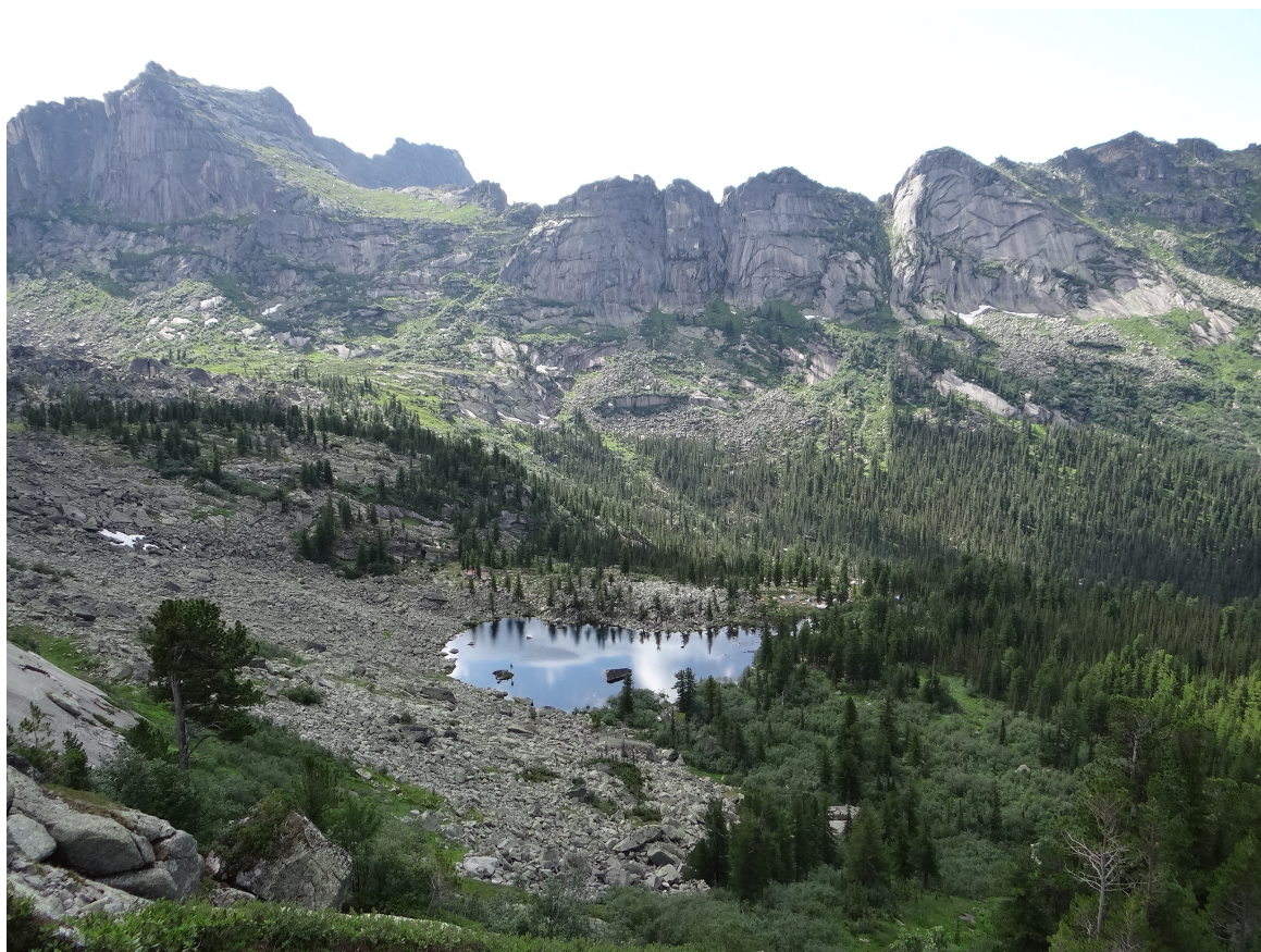
Рис.6 Вид на озеро Художников с озера Горных Духов