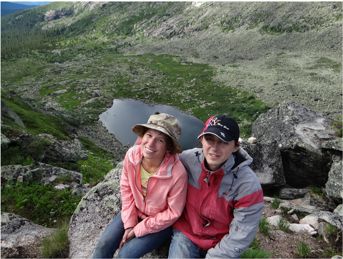
Рис.3 На перевале Сказка, на заднем плане озеро Сказка