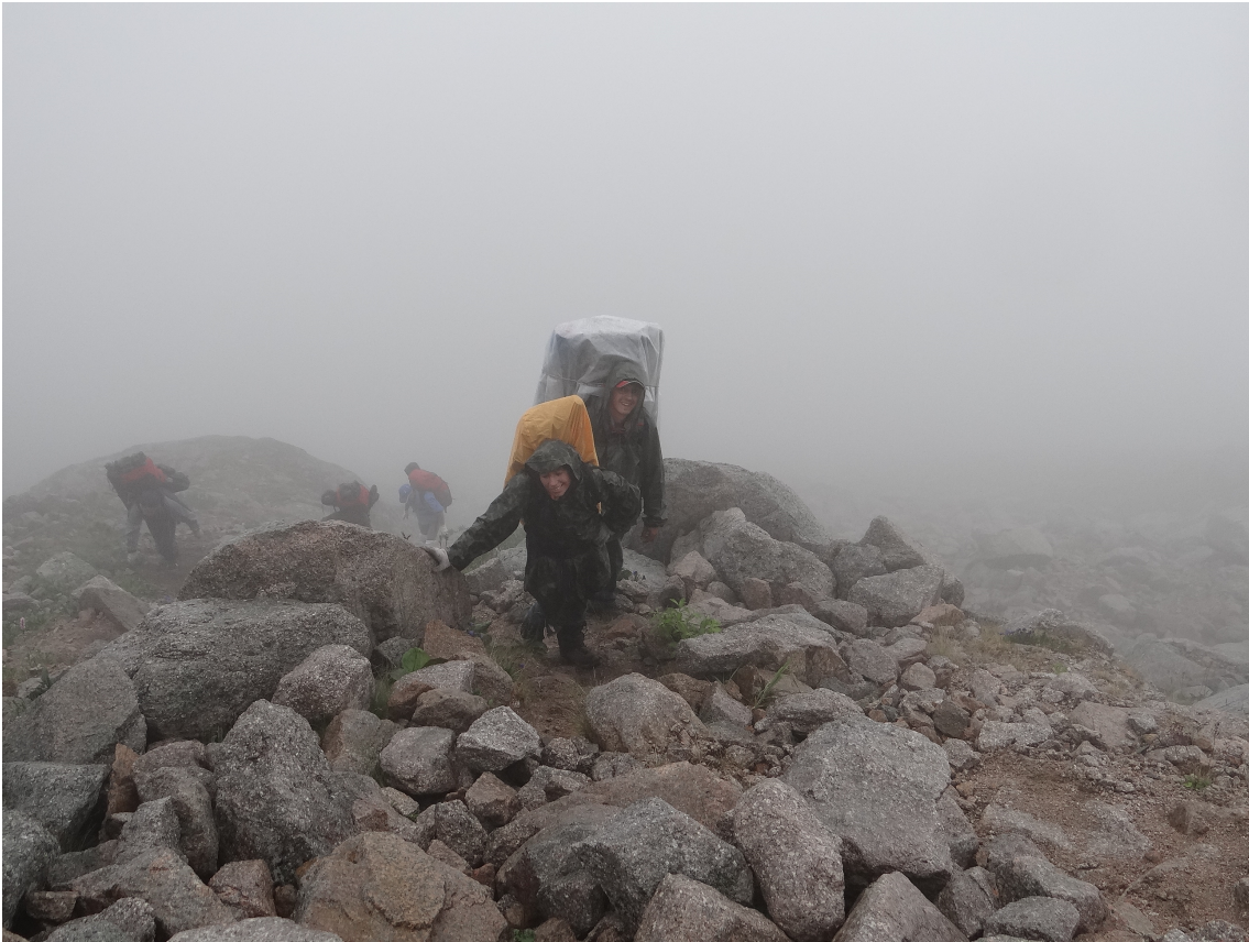
Рис. 7 Преодолеваем перевал Художников. Пасмурно. Видимость плохая