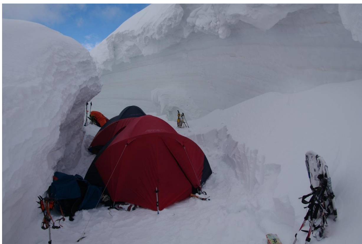
Рис. 4.13. Ночевка в трещине на высоте 5700 м под вершиной п. Семенова.

30.07 (9-й день). Вышли в 8-45. Зря я поддался на провокационные рассуждения, что на высоте, мол, по утрам холодно. Пробитую тропу замело лишь частично, т.е. не напрасны были наши труды накануне. Выше 5300 обули снегоступы. Почти у всех в группе они самодельные, из алюминиевых обручей. К счастью, у двоих участников это снаряжение фирменное, что позволяет пробивать плотную фирновую корку и делать надежные ступени в подстилающем ее сухом снегу. Это не «доска», лавинной опасности нет, однако плотность фирна такова, что пробить его самодельными снегоступами сложно, из-за того, что они привязаны к ботинкам и жесткого удара не получается. Двое идущих впереди обувают фирменные снегоступы по очереди, что позволяет поддерживать высокий средний темп. К 15-30 мы поднялись на 5700 и обосновались для ночевки в уютной широкой трещине. До этого места приемлимой площадки для ночевки на склоне нет (рис. 4.13).