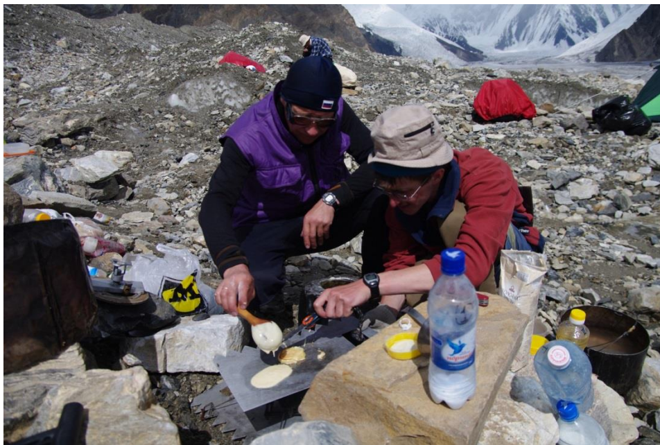
Рис. 4.18. Оладушки по походному.

2.08 (12-й день). Дневка и обычные, связанные с ней, походные радости (рис. 4.18).