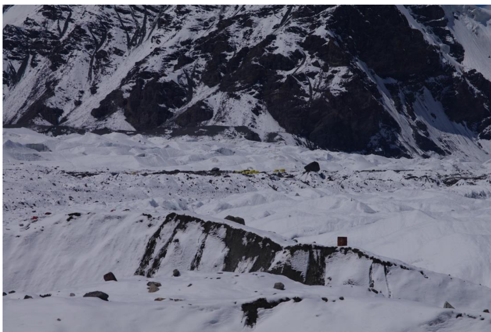
Рис. 4.25. Два МАЛа разделяет примерно полчаса ходьбы.

9.08 (19-й день). Утром кое-где синее небо, после обеда – яркое солнце. Сходили в лагерь Грекова (рис. 4.25), обсудили с ним тактику восхождения на п. Победы. Дмитрий подчеркнул, что отсутствие ночевки на 6500 сильно снижает шансы на успех и посоветовал писать в GPS трек от Важи до вершины Победы.