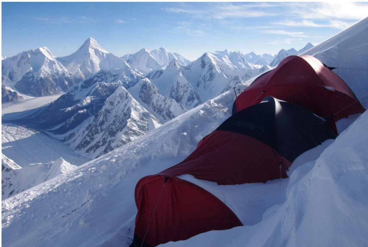
Рис. 4.28. В лагере на 6100. На заднем плане п. Хан-Тенгри.

13.08 (23-й день) Вышли в 9-00, к 16-00 поднялись в лагерь на 6100 м с промежуточным обедом возле пещеры на 5800 (рис. 4.28). Перила такие, что за них страшно братья. А что делать! Вечером пошел снег.