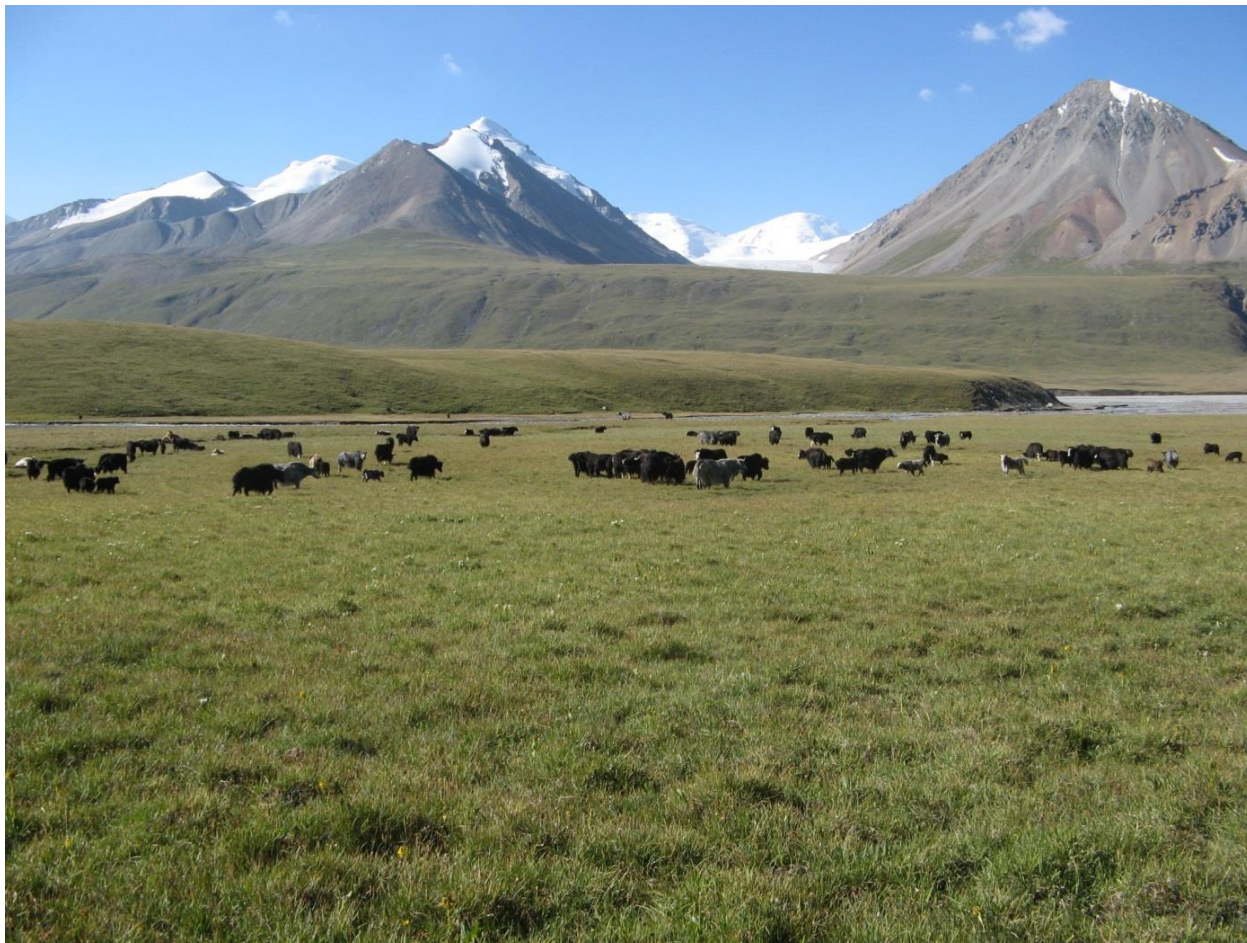
Рис. 4.2. Пастбище со стадом яков на слиянии Ашу-тора и Сарыджаза

22.07. (1-й день). Выехали вверх по Сарыджазу в 7-30, добрались до Ашу-тора к 10-00. Дальше дороги нет, до этого места она была вполне приемлимой. Легко перебродили Ашу-тор (разувшись) и в 12-00 встали лагерем. Здесь уже 3300 м, нужно привыкнуть к высоте. Погуляли после обеда по окрестностям. С правого склона виден Хан-Тенгри (рис. 4.3, 4.3а).