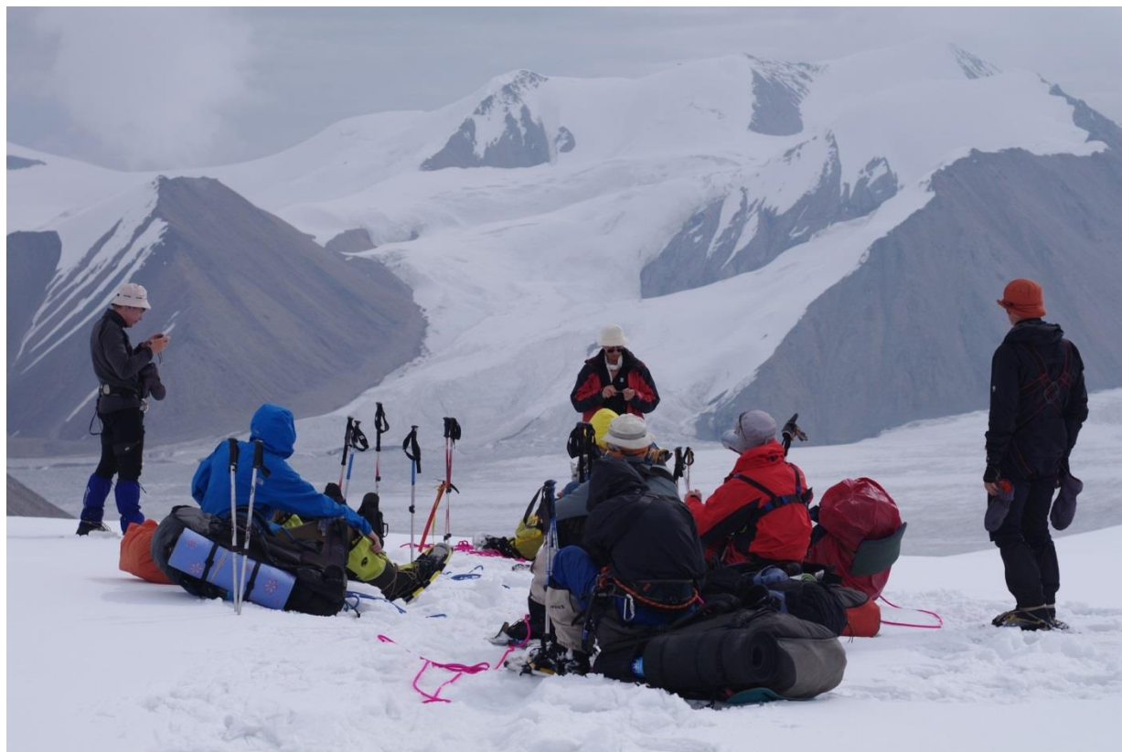
Рис. 4.8. Группа на седловине перевала Мушкетова (1Б, 4400 м).

25.07 (4-й день). Вышли в 7-00, залезли на ледник и обули снегоступы. В тумане поднялись на седловину пер. Мушкетова (1Б, 4400 м) к 10-00 (рис. 4.8). Спустились с седловины по ледово-фирновому гребню по ходу слева. Можно было и по центру, но из-за снежного наддува этот путь плохо просматривался. К 11-30 снова упали на ледник Семенова, на 4068 м и до 13-00 обедали. Дальше за ходку прошли открытый ледник, связались и к 16-00 поднялись на 4300 м, под снежное ребро, выводящее на перевал Опасный.