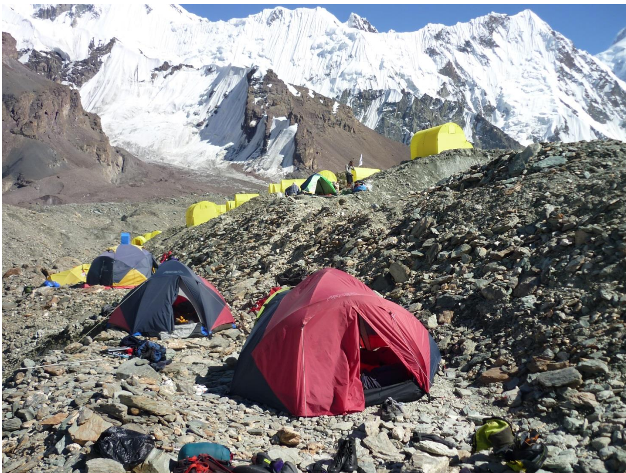
Рис. 4.29. В МАЛе на леднике Звездочка. За трещиной на переднем плане ставят палатки обладатели «бичпакета».

18.08 (28-й день). Пошли вниз по Южному Иныльчеку. Стартовали около 8-00, к 11-00 подошли в лагерь на леднике Дикий, где нас угостили чаем (рис. 4.30). Тропа по леднику отлично размечена турами и хорошо заметна, местами даже набита. К 19-30 встали на ночевку, не дойдя около двух часов до поляны Мерцбахера.