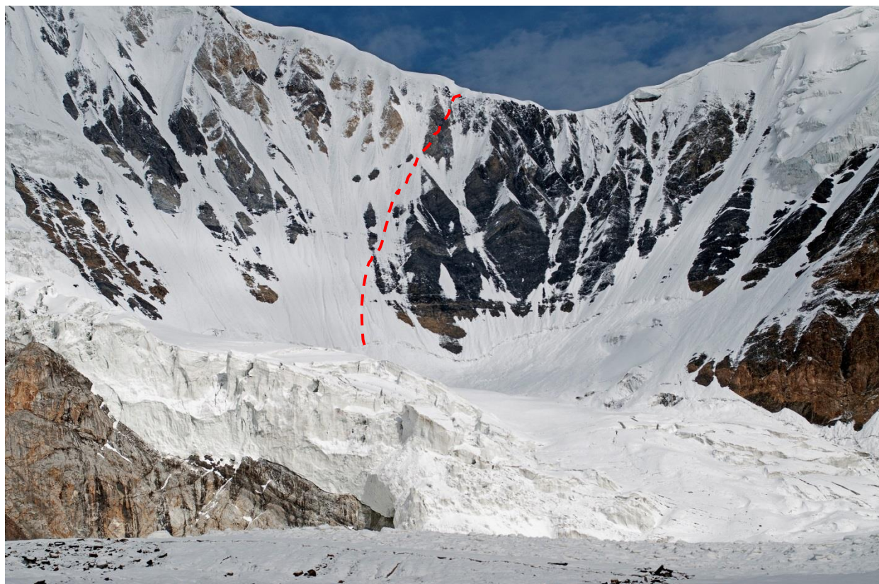
Рис. 4.15. Перевал ЛКТ со стороны л. Одиннадцати и наш путь спуска.

Всего до выполаживания потребовалось 14 веревок, которые фиксировали на ледобурах и проушинах (рис. 4.15). К месту ночевки подошли в сумерках, около 21-00. Приблизительно в 17-00 погода испортилась, пошел легкий снег, временами видимость падала до 100 м. Отмечены падения отдельных камней, один из участников получил ушиб плеча. Заночевали на 4600 м.