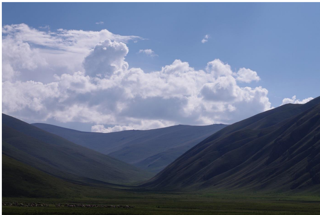
Рис.2.2.1. Сырты Тянь-Шаня. За горами – долина Сары-Джаза

Для посещения района требуется оформление пропусков, что можно осуществить заранее, по договоренности с принимающей компанией. До впадения р. Ашу-тор в р. Сарыджаз можно добраться на автомобиле повышенной проходимости. Мы ехали на «Зил». Грунтовая дорога пристойного качества, местами с улучшенным покрытием, имелась на протяжении всего пути. Дорога очень живописна (рис. 2.2.1)