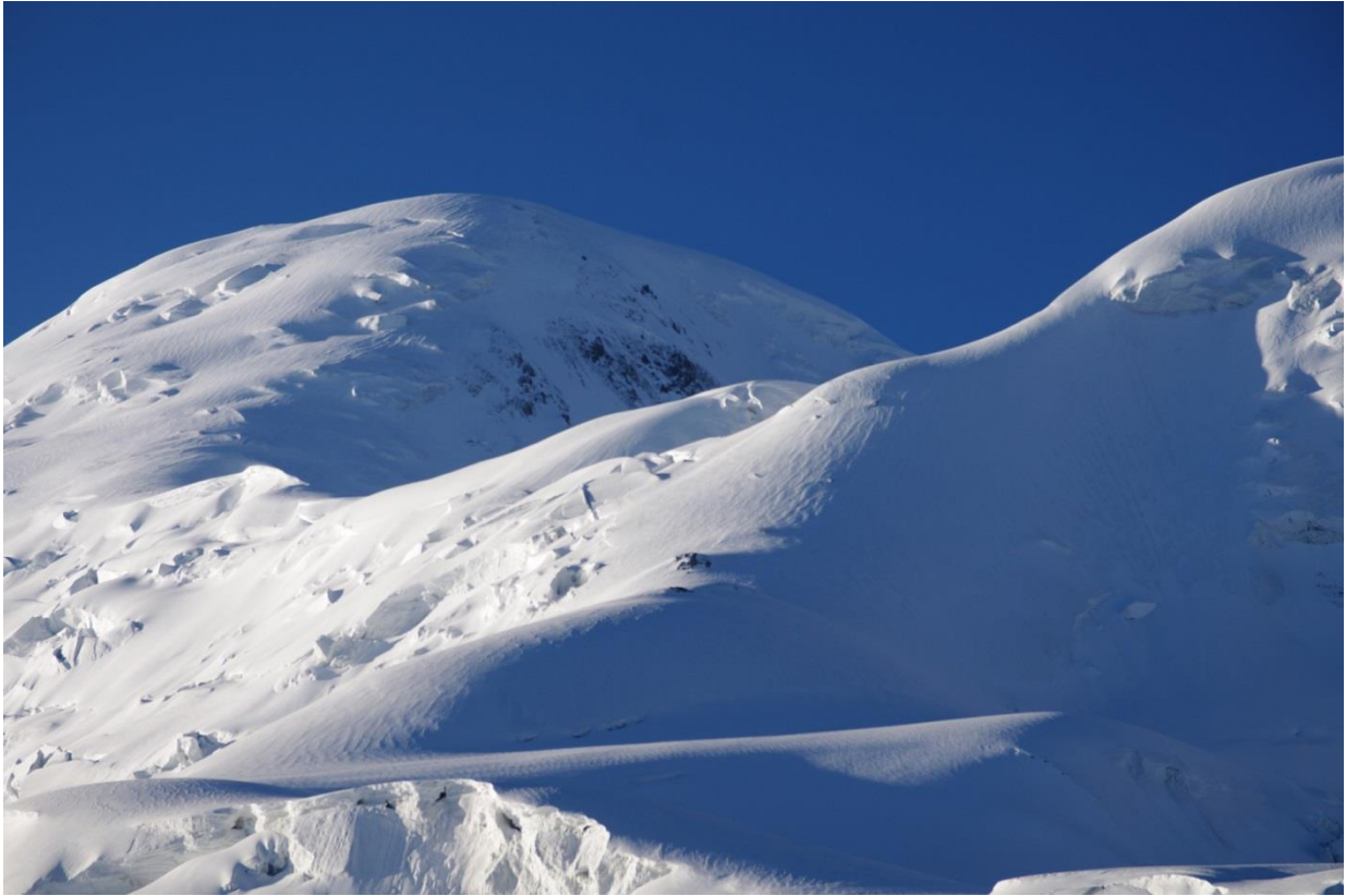
Рис. 4.9. Ребро, выводящее на пер. Опасный с ледника Семенова. Место ночевки – на правом склоне «узкой» седловины.

На последнем взлете пришлось повесить пару веревок. Взлет выводить на косой траверс, после которого склон окончательно выполаживается, но на траверсе нужно быть аккуратным – жесткий фирн. На 5050 м. мы поднялись к 13-30 и вытоптали площадку для ночевки под уютным сераком (рис. 4.10). Вставать выше нецелесообразно. На самой седловине есть закрытая мульда, но в ней, похоже, всегда ветрено, судя по тому, как вылизан образующий ее фирн. Ночуем вдсятером в двух палатках «Северная звезда» и приходим к выводу, что это слишком тесно. Зато оказалось, что эти две палатки, соединенные тамбурами, образуют очень комфортное жилище (рис. 4.11).