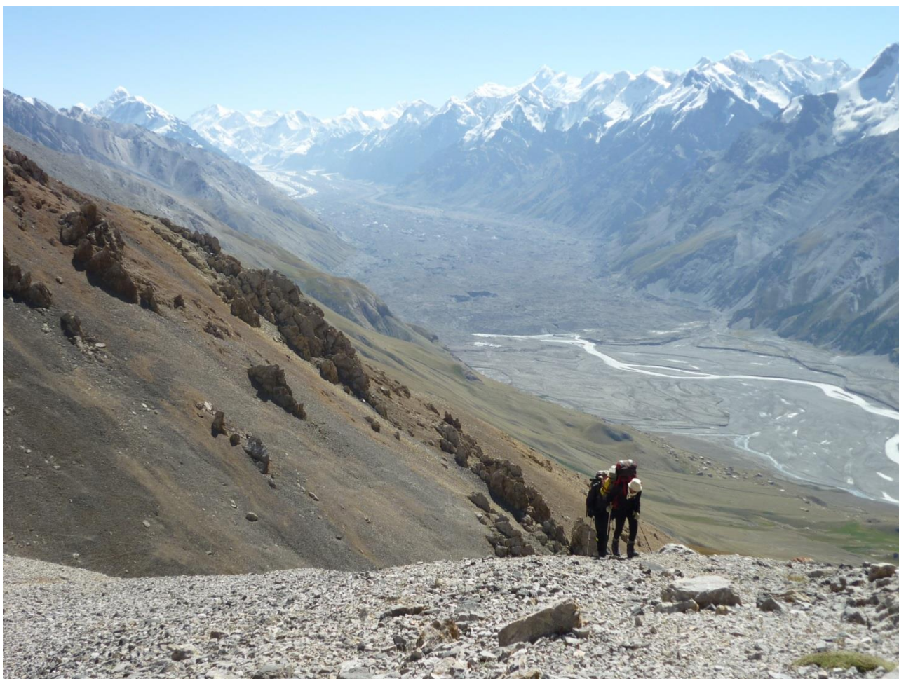
Рис. 4.34. Подъем на перевал ТЮЗ со стороны Иньльчека.

21.08 (31-й день). Вышли в 8-00, к 9-30 подошли к повороту на ТЮЗ (1Б, 4000 м). По тропе, за 3.5 часа, поднялись на седловину с 2800 м. Великолепные виды (рис. 4.34).