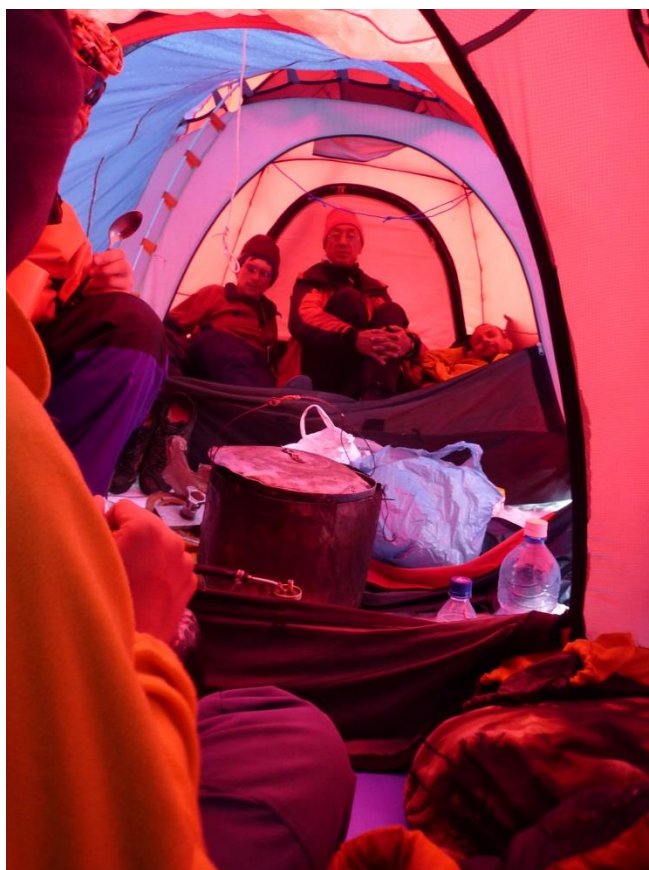
Рис. 4.11. Внутри палаток «Северная звезда», соединенных тамбурами.

27.07 (6-й день). Вышли около 7-00. От вчерашних ступеней не осталось и следа – задуло ветром. К 9-30 спустились на ледник. Погода простояла до 11-30, потом из Китая натянуло