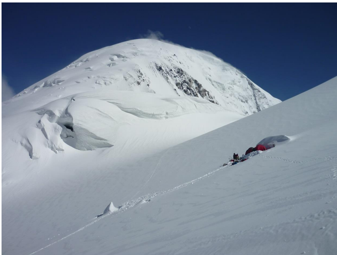
Рис. 4.10. Ночевка на высоте 5010 м. на пер. Опасный. На заднем плане п. Семенова (5806 м).