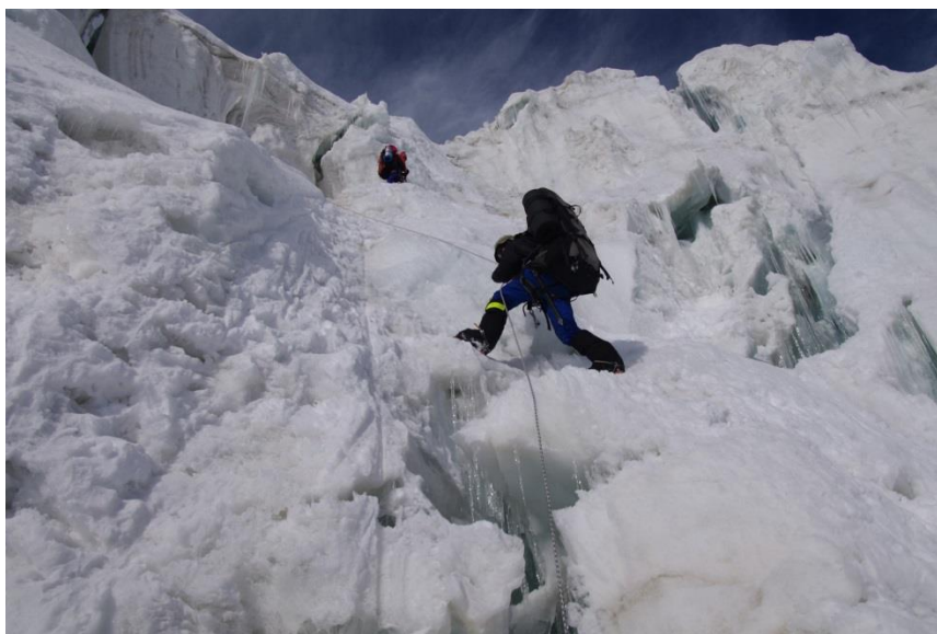
Рис. 4.27. Перила в ледопаде, по пути на пер. Дикий.

12.08 (22-й день). Вышли около 7-30, без проблем прошли ледопад по провешенным веревкам, которые в этом году не слишком сложные (рис. 4.27). К 16-00 поднялись на 5300, выше седловины перевала Дикий. Идем по следам, протоптанной тройкой с позывными «Победа-3». Правда, прямой связи у нас с ними нет из-за разных частот у раций. Мы разговариваем со своей тройкой, оставшейся в МАЛе.