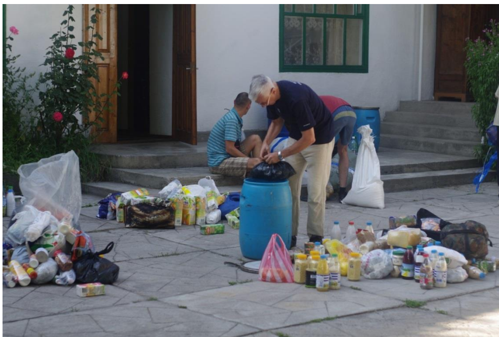
Рис. 4.1. Погрузка забросок в бочки в Караколе, на базе фирмы «Неофит»

20.07. После прилета в Бишкек и встречи с Н. Н. Щетниковым выехали в Каракол до которого и добрались по южному берегу Иссык-Куля к 00-30. Остановились в гостинице фирмы «Неофит». Дорого, но комфортно. Отличная еда.