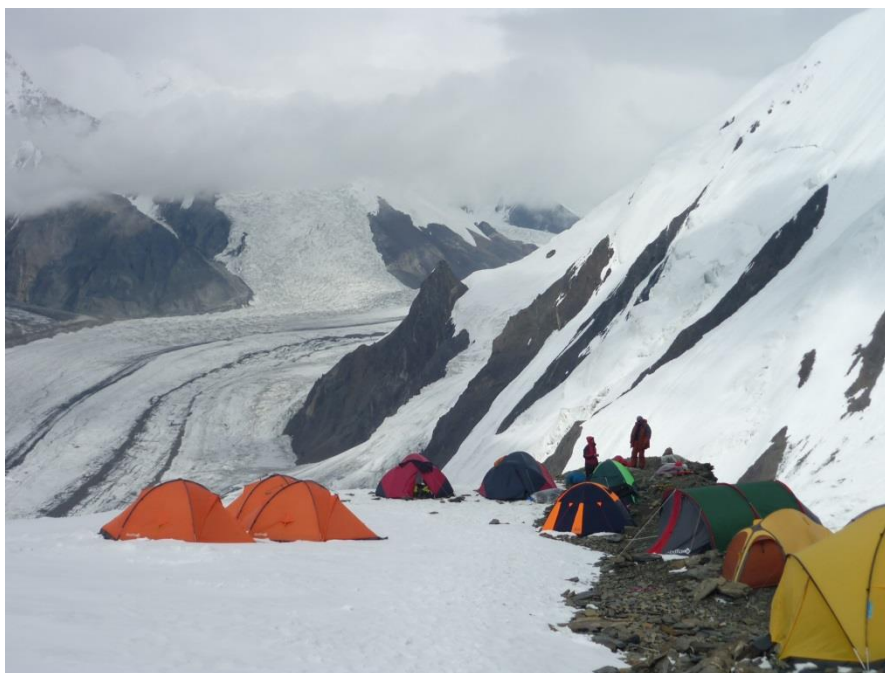
Рис. 4.19. Лагерь 1 на плече Петьки (4550 м).

3.08 (13-й день). Хотели выйти «как обычно», но снизу пришли облака, подул сильный ветер и пошел снег. Поэтому стартовали только в 10-00. К 11-10 подошли под начало перил на Петьку. К 13-30 поднялись на 4550, в лагерь 1 (рис. 4.19). Вечером стали подходить иностранцы снизу и украинцы сверху, с Хана. По словам последних, ночевок для девяти человек на 6500 на Хане нет. Обсудив ситуацию, решаем дважды заночевать на Петьке (6120 м). Тут пригодился спутниковый телефон – обсудили ситуацию с В. Юдиным.