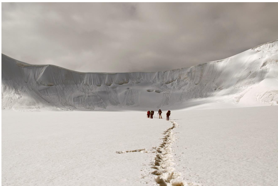
Рис. 4.7. Подход к взлету перевала Удачный. Мы поднялись на седловину по ребру в правой части снимка.

24.07 (3-й день). Вышли в 7-45, через ходку пришлось одеть снегоступы - снега по пояс. К 10-30 подошли под перевальный взлет. Снежные козырьки с седловины смотрятся угрожающе, выбираем обход справа (рис. 4.7). Снег сильно раскис, пришлось даже топтать следы без рюкзаков. К счастью, погода радует. На седловину перевала Удачный выбрались в 13-30. Тура нет, спуск очевиден. Пообедали, спустились в правый ранклюдфл ледника Мушкетова. Прошли вверх по ранклюдфлу примерно полчаса и около 16-00 встали на отличных стоянках правой морены на ночевку (4150 м). Погода испортилась в 17-00.