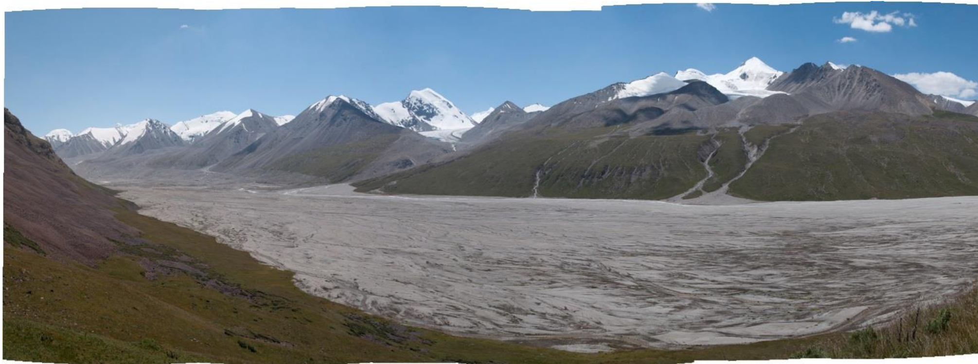
Рис. 4.4. Панорама долины р. Сарыджаз. Ледник Семенова, из которого она вытекает, в левом углу.