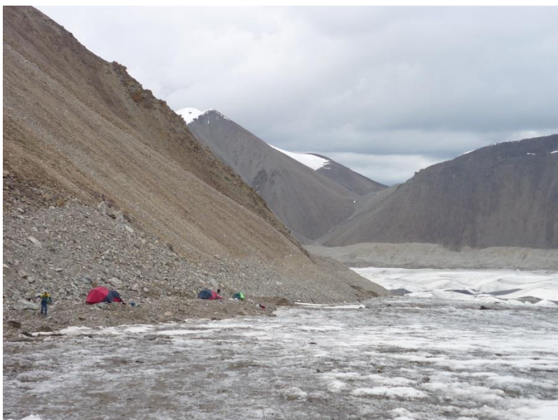
Рис. 4.6. Ночевка на правом борту ледника, выводящего на перевал Удачный.

24.07 (3-й день). Вышли в 7-45, через ходку пришлось одеть снегоступы - снега по пояс. К 10-30 подошли под перевальный взлет. Снежные козырьки с седловины смотрятся угрожающе, выбираем обход справа (рис. 4.7). Снег сильно раскис, пришлось даже топтать следы без рюкзаков. К счастью, погода радует. На седловину перевала Удачный выбрались в 13-30. Тура нет, спуск очевиден. Пообедали, спустились в правый ранклюдфл ледника Мушкетова. Прошли вверх по ранклюдфлу примерно полчаса и около 16-00 встали на отличных стоянках правой морены на ночевку (4150 м). Погода испортилась в 17-00.