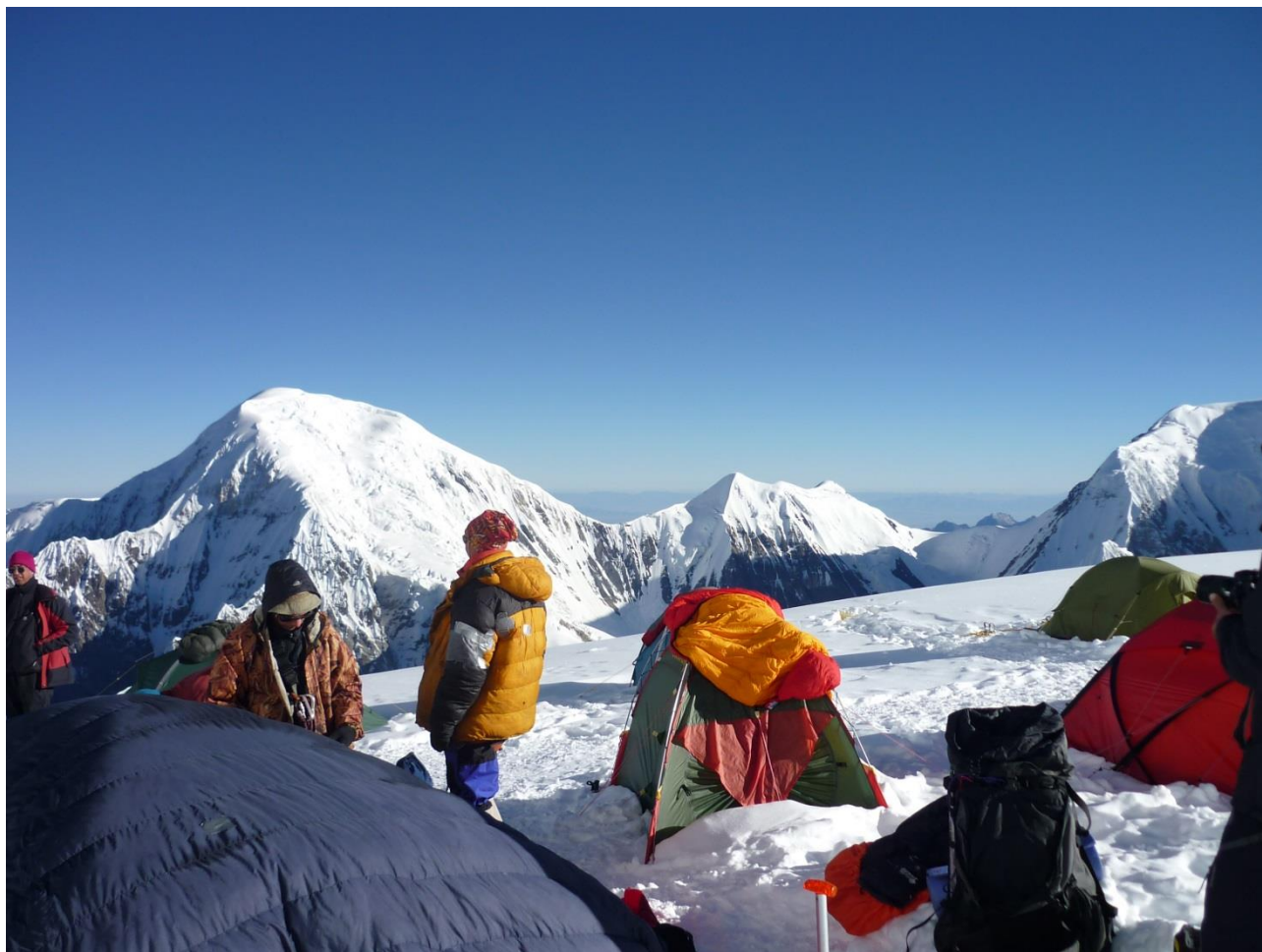
Рис. 4.20. Лагерь 2 на пути к вершине Петьки. На заднем плане п. Семенова и пер. ЛКТ.

4.08 (14-й день). Вышли в 8-00, к 13-30 поднялись по перилам на 5200, где пообедали. Место не самое удобное, пришлось вырыть небольшую площадку, но отдых был необходим. К 16-30 выбрались в лагерь 2 на 5490 м (рис. 4.20). Скалы сильно заснежены, движение по перилам достаточно утомительно.