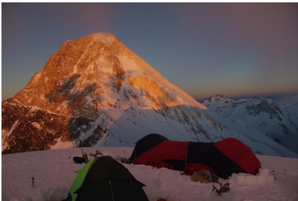
Рис. 4.21. Ночевка на Петьке перед восхождением на Хан-Тенгри.