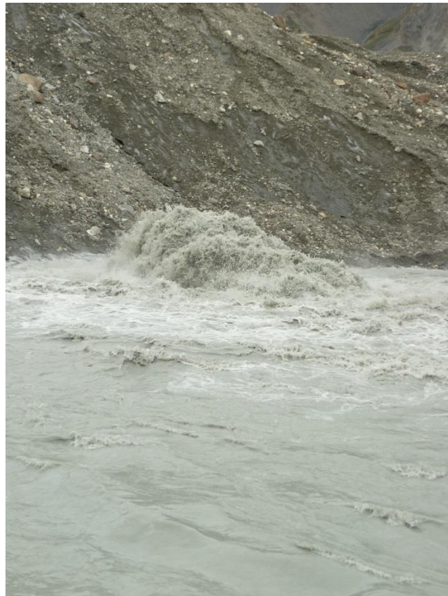
Рис. 4.33. Исток р. Иньльчек.

20.08 (30-й день). Вышли в 8-00, к 12-00 подошли под ледник Путеводный, пообедали. К 15-00 добрались до конца тропы вдоль Южного Иньльчека. Пересекли Иньльчек по морене, вышли на правый берег одноименной реки. Поражает фонта в рост человека, бьющий из-под ледника – он дает начало реке (рис. 4.33). Около 16-30 встали на ночевку в 4 км от перевала ТЮЗ.