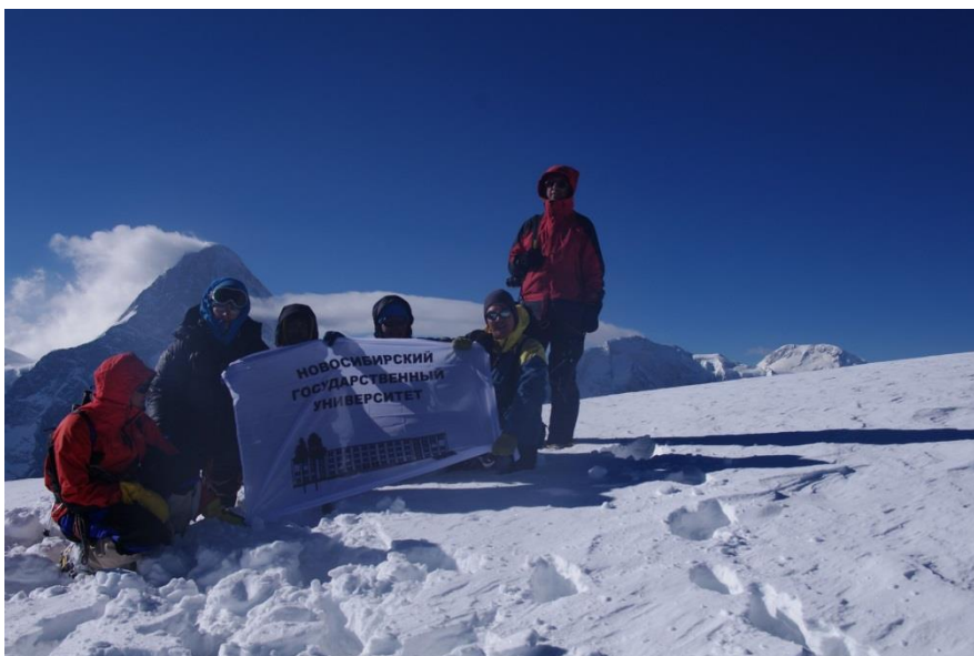
Рис. 4.14. Группа на вершине п. Семенова. На заднем плане п. Хан-Тенгри.

Всего до выполаживания потребовалось 14 веревок, которые фиксировали на ледобурах и проушинах (рис. 4.15). К месту ночевки подошли в сумерках, около 21-00. Приблизительно в 17-00 погода испортилась, пошел легкий снег, временами видимость падала до 100 м. Отмечены падения отдельных камней, один из участников получил ушиб плеча. Заночевали на 4600 м.