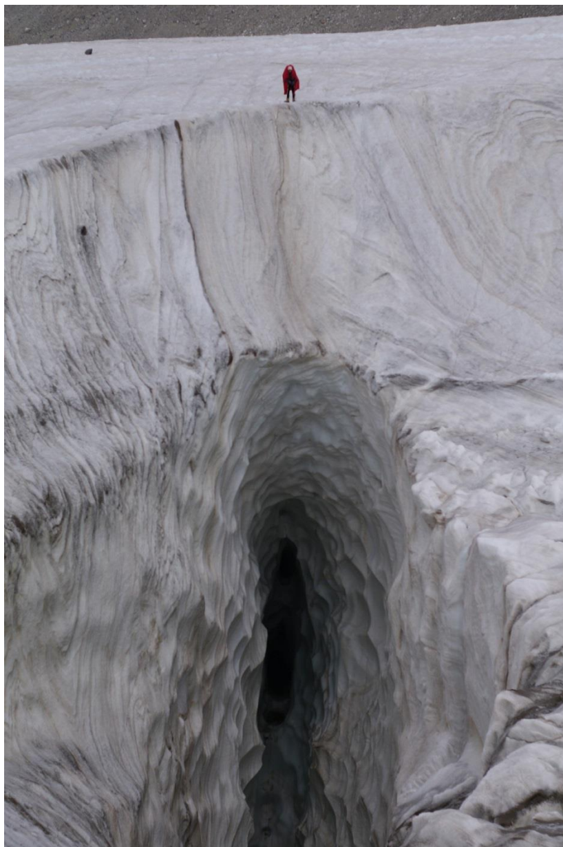
Рис. 4.5. На леднике Семенова

23.07 (2-й день). Вышли в 7-30, по небу протащило цирусы. Под ледник вышли к 10-00, полезли в правый ранклюдт, при этом через полчаса пришлось обуть кошки. Немного попутали открытый ледник, в 12-30 обедали на 3700 м. Вышли с обеда в 14-30, через ходку налетела конкретная туча и пошел дождик. Красивый открытый ледник (рис. 4.5). Свернули направо к перевалу Удачный (1Б-2А, 4400 м), заночевали на 3950 м на левой морене (рис. 4.6). Послеобеденный дождик закончился примерно в 20-00.