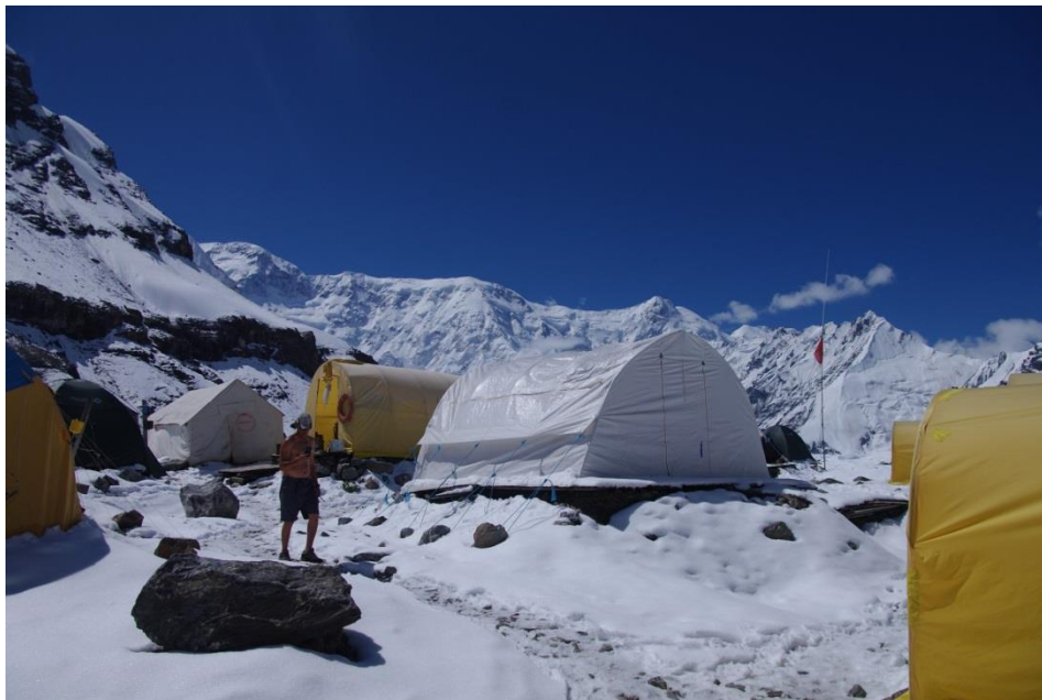
Рис. 4.24. В «бирюковском» МАЛе, утро после снегопада.