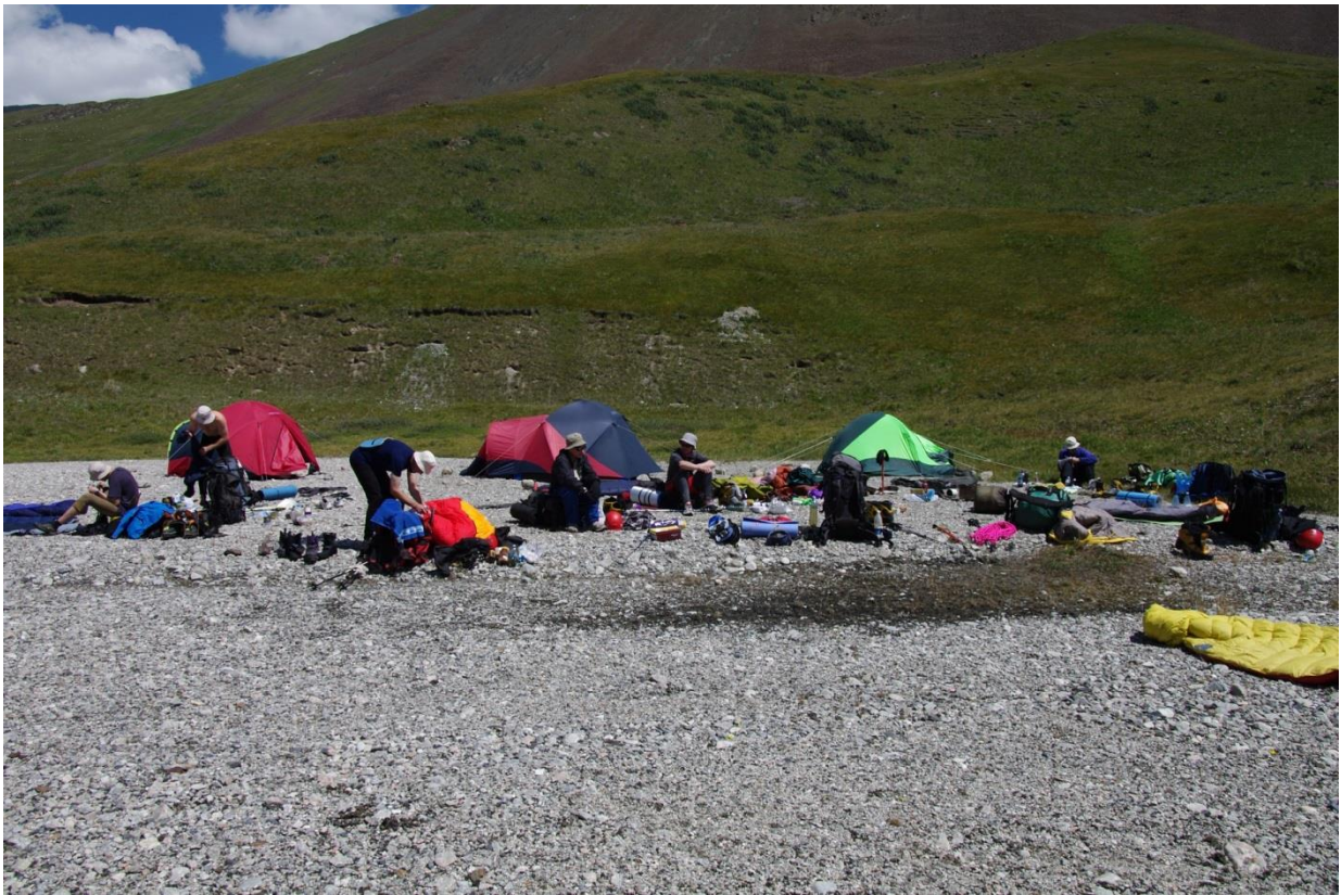
Рис 4.3. Лагерь на высоте 3300 м на правом берегу Сарыджаза