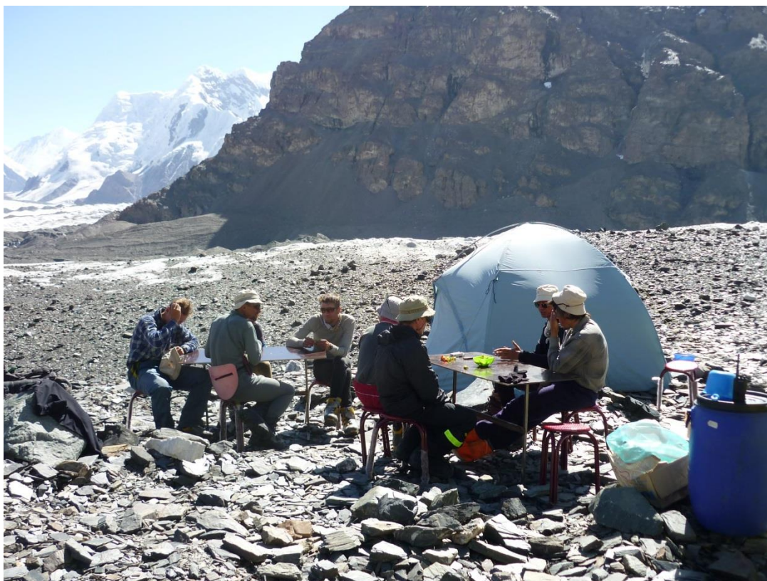
Рис. 4.30. В промежуточном лагере на леднике Дикий. Хорошо сидим.

19.08 (29-й день). Вышли в 8-00, к 10-00 добрались до поляны Мерцбахера (рис. 4.31). Поставили палатки, прогулялись на озеро Мерцбахера, поглазели на айсберги (рис. 4.32). Ночевка на травке.