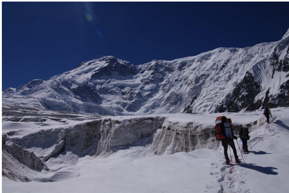
Рис. 4.26. В ледопаде ледника Звездочка. Только в связках!

11.08. (21-й день). Вышли в 8-30, к 13-30 по размеченной тропе пришли в лагерь 1 на леднике Звездочка на 4400 м (рис. 4.26).