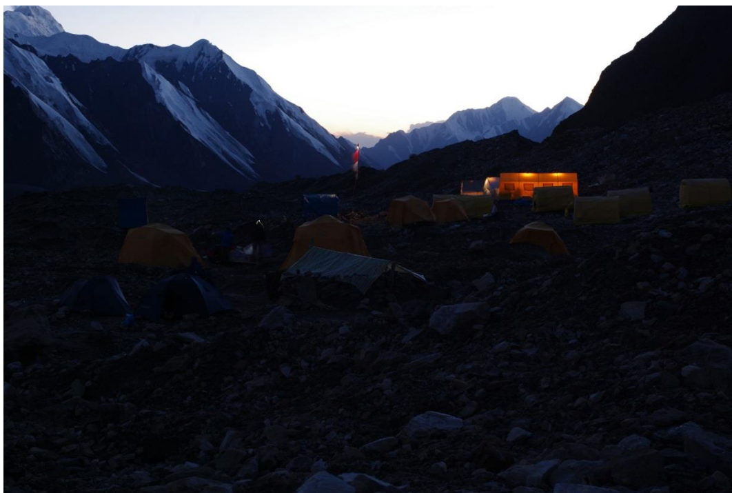
Рис. 4.16. МАЛ на Северном Иньльчеке.

В МАЛе нас встретили очень хорошо (рис. 4.16, 4.17). Начальник Миша Кузьмин – отличный парень, наши разнообразные мелкие просьбы были встречены с пониманием. Вопрос об оплате перил на Петьку не поднимался.