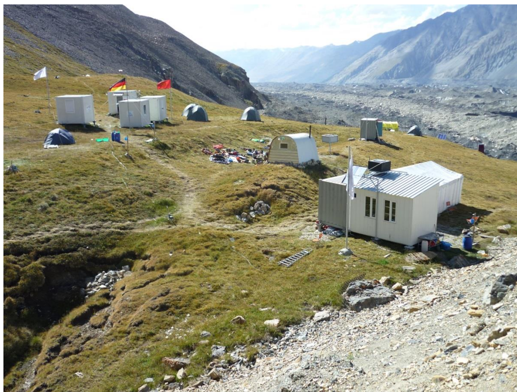
Рис. 4.31. Поляна Мерцбахера. В 1990 г. здесь был только домик с трубой, тот, что в центре.

19.08 (29-й день). Вышли в 8-00, к 10-00 добрались до поляны Мерцбахера (рис. 4.31). Поставили палатки, прогулялись на озеро Мерцбахера, поглазели на айсберги (рис. 4.32). Ночевка на травке.