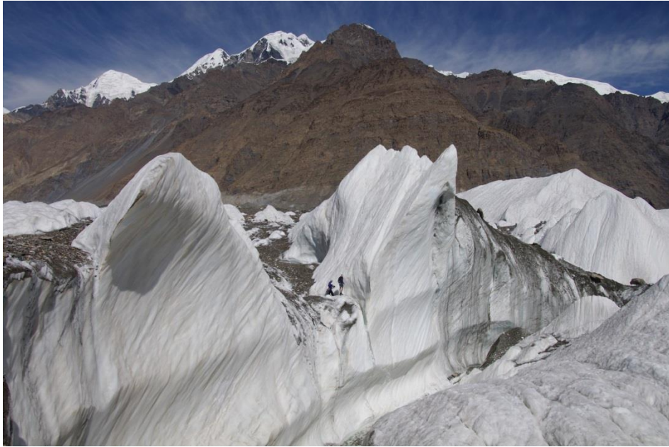
Рис. 4.32. Здесь было озеро Мерцбахера.

20.08 (30-й день). Вышли в 8-00, к 12-00 подошли под ледник Путеводный, пообедали. К 15-00 добрались до конца тропы вдоль Южного Иньльчека. Пересекли Иньльчек по морене, вышли на правый берег одноименной реки. Поражает фонта в рост человека, бьющий из-под ледника – он дает начало реке (рис. 4.33). Около 16-30 встали на ночевку в 4 км от перевала ТЮЗ.