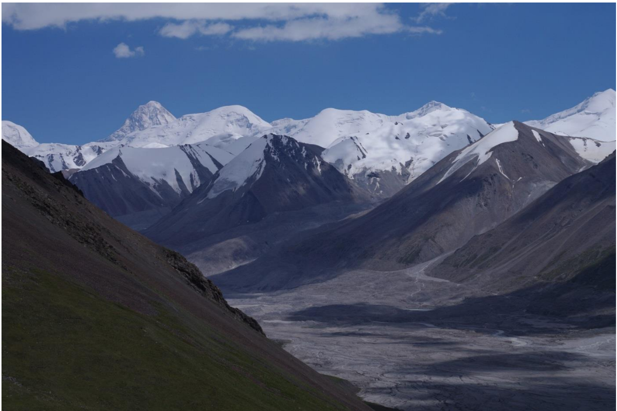
Рис 4.3а. п. Хан-Тенгри (самый высокий), справа от него п. Семенова