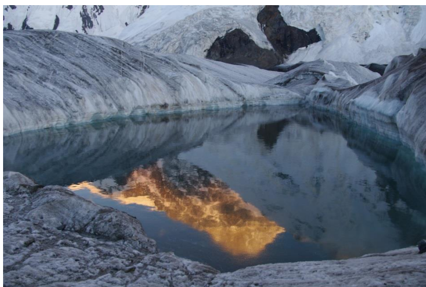
Рис. 4.17. Отражение Хана