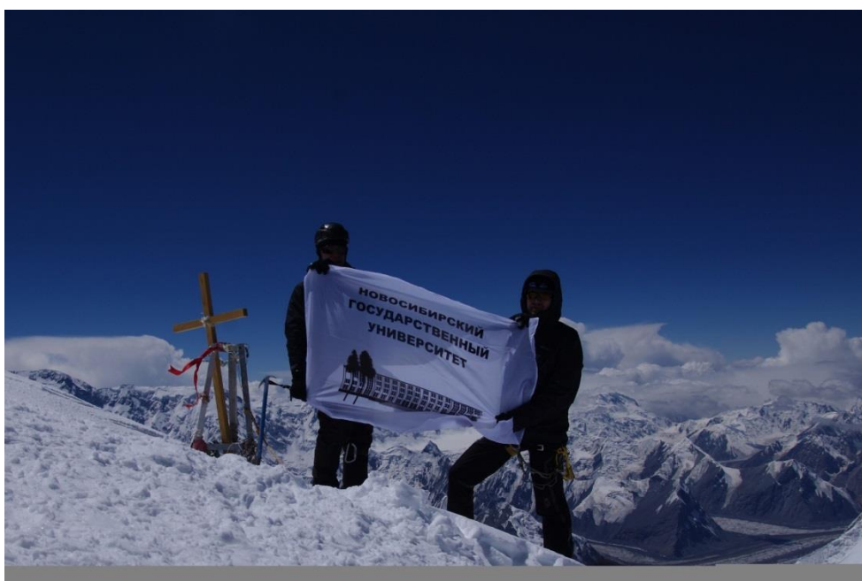
Рис. 4.22. На вершине Хан-Тенгри.