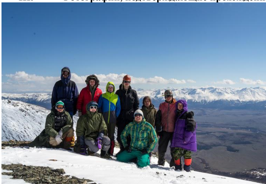
Группа на перевале Ортолык-Кубадру