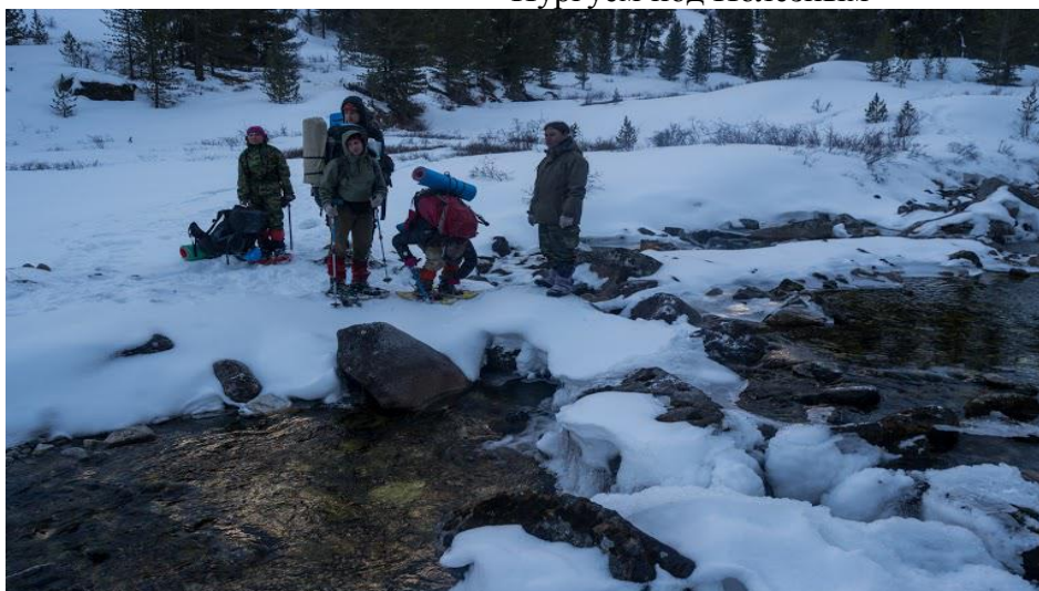
На переправе через Левую Кубадру