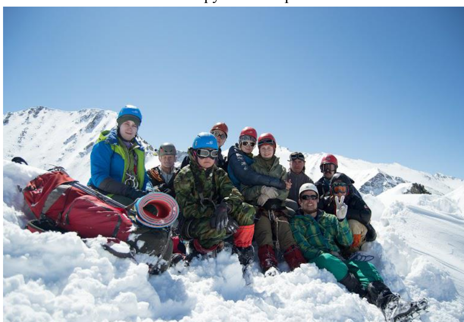
Группа на перевале Полезный