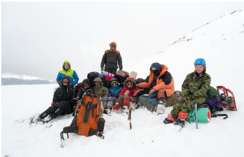
Группа мерзнет на перевале Таджили