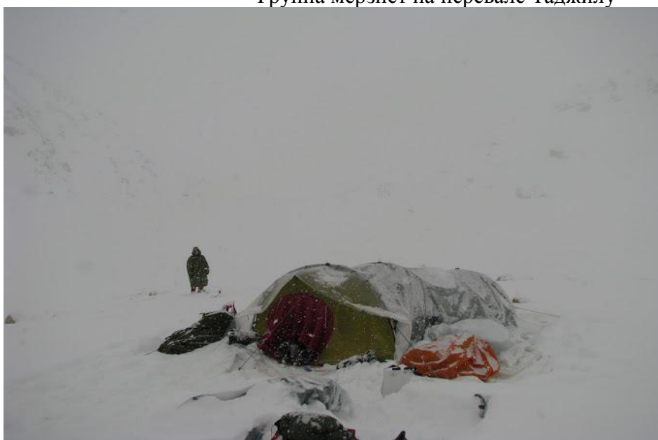
Пургуем под Полезным