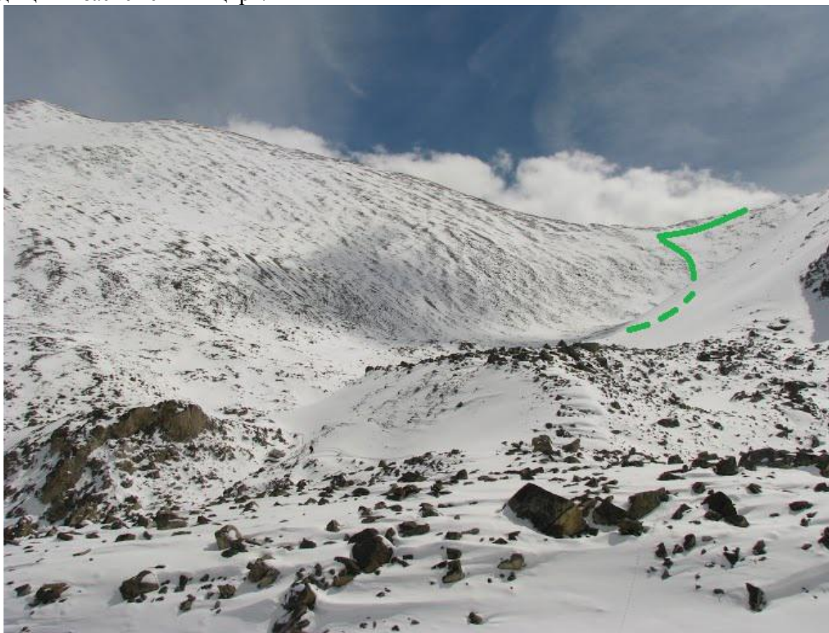
2.1.3.Пер. Полезный (1Б, 2970)