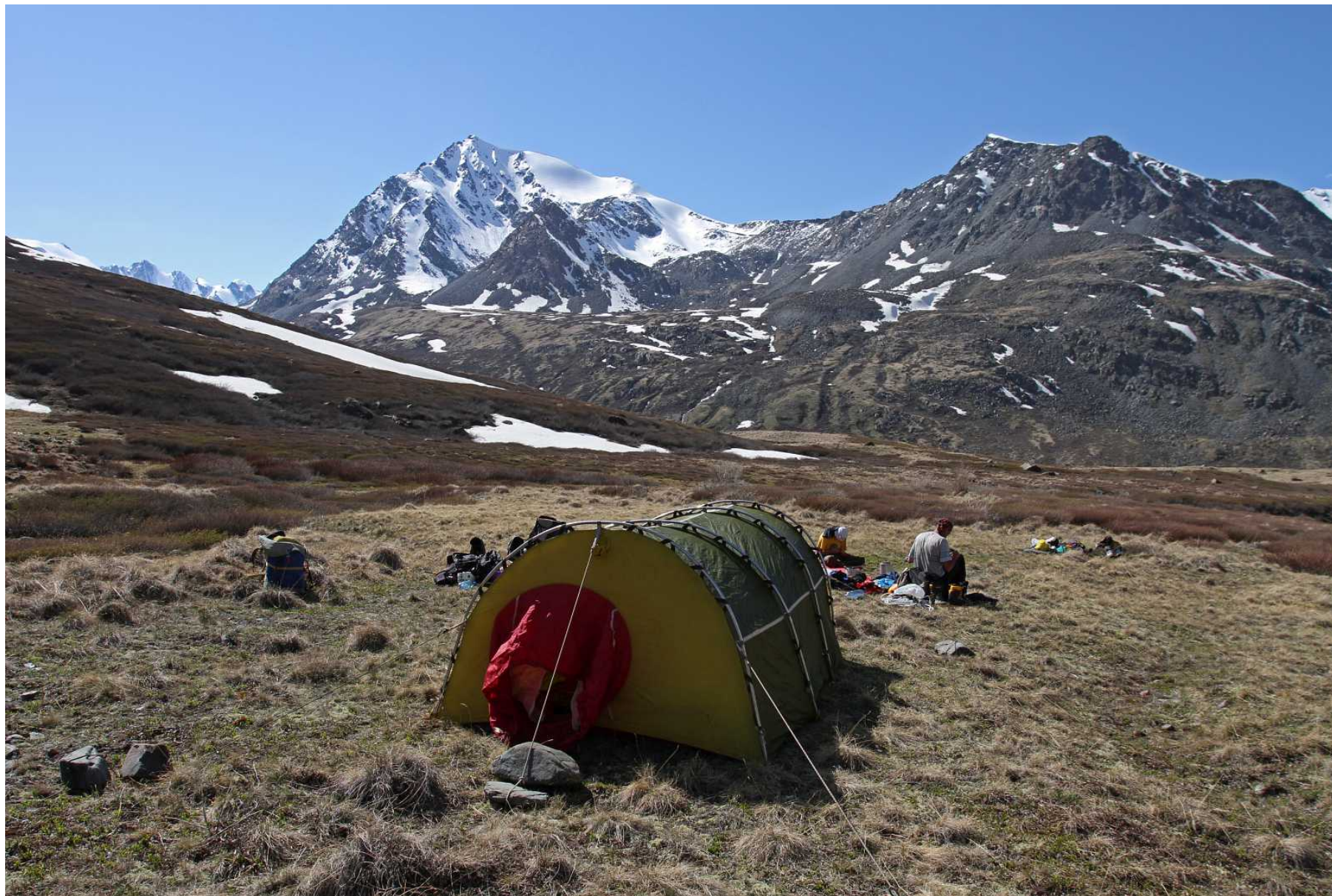
Фото 102. Стоянка на левом берегу Правого Караююка. Вид на запад, вершина 3655.6