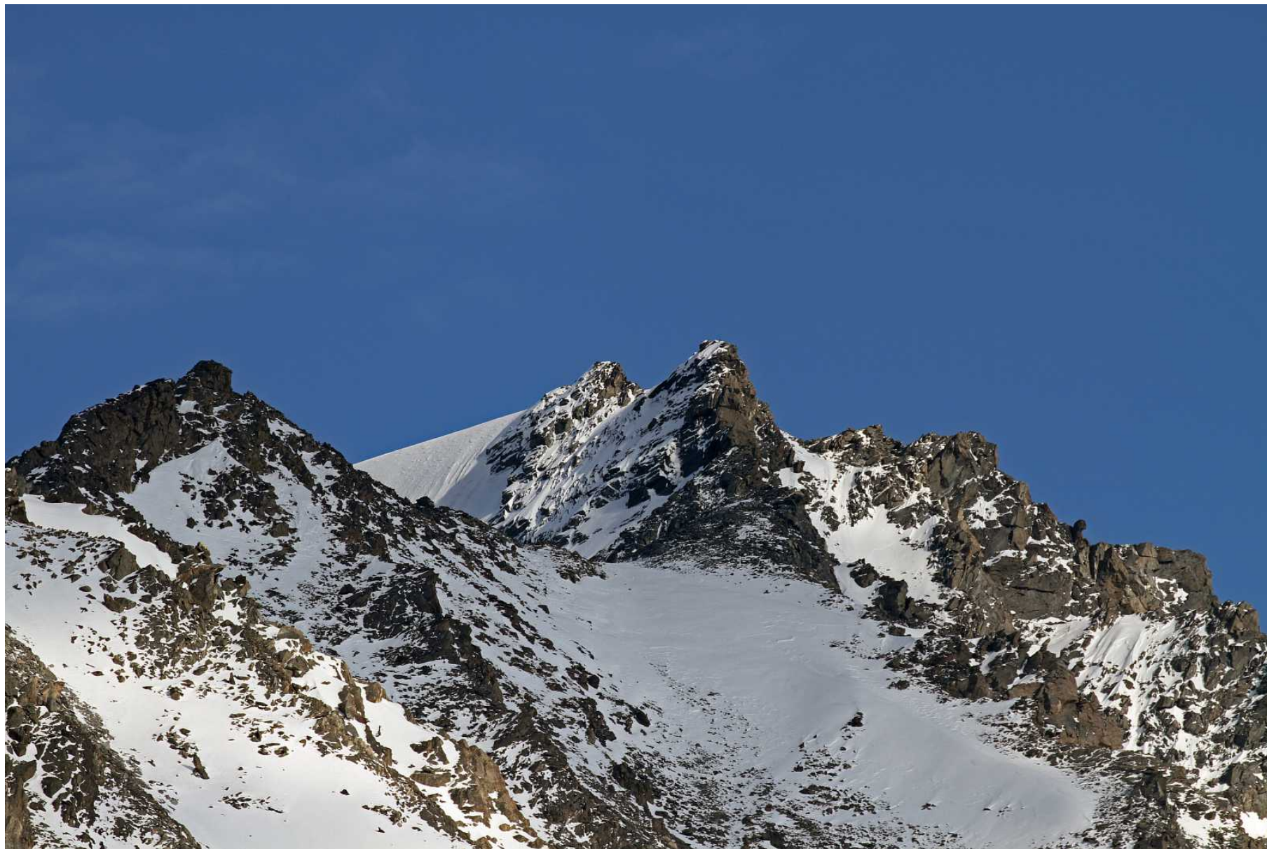
Фото 77. Вершина 3655.6 к востоку от перевала Удачный (теле). Вид от стоянки вечером 11 июня