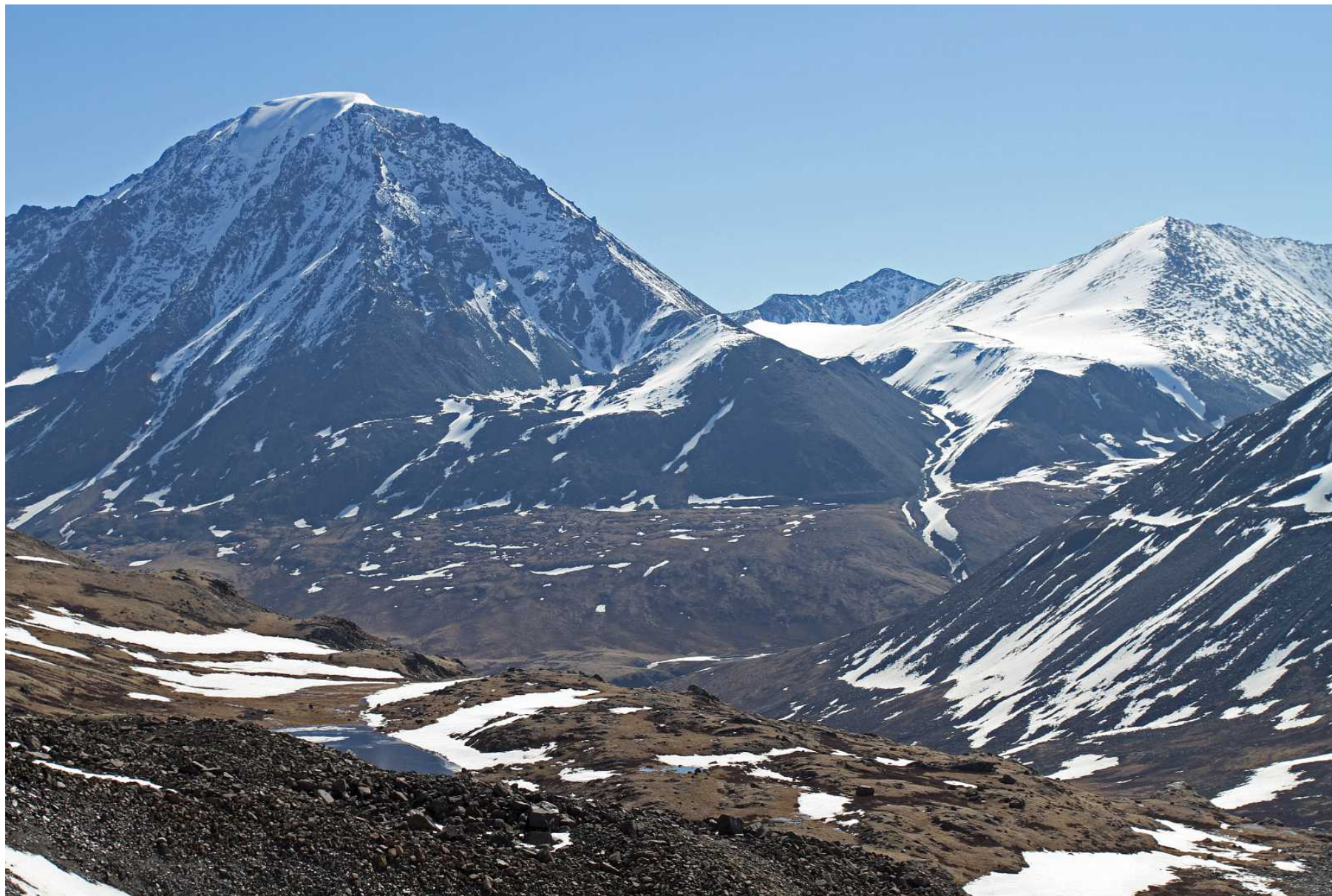
Фото 92. Озеро на террасе левого борта долины Караюк, вершина Джаникту и верховая долина перевалов Рубцовский и Рублевского