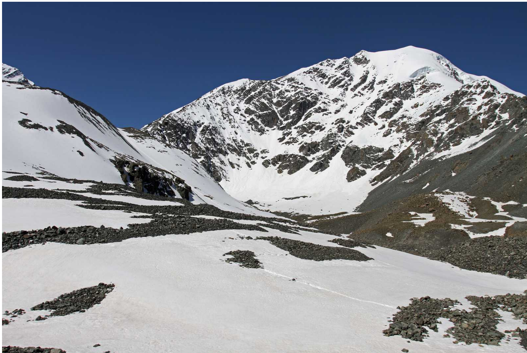
Фото 113. Вид назад, на путь спуска по моренам и вершину Джаникту