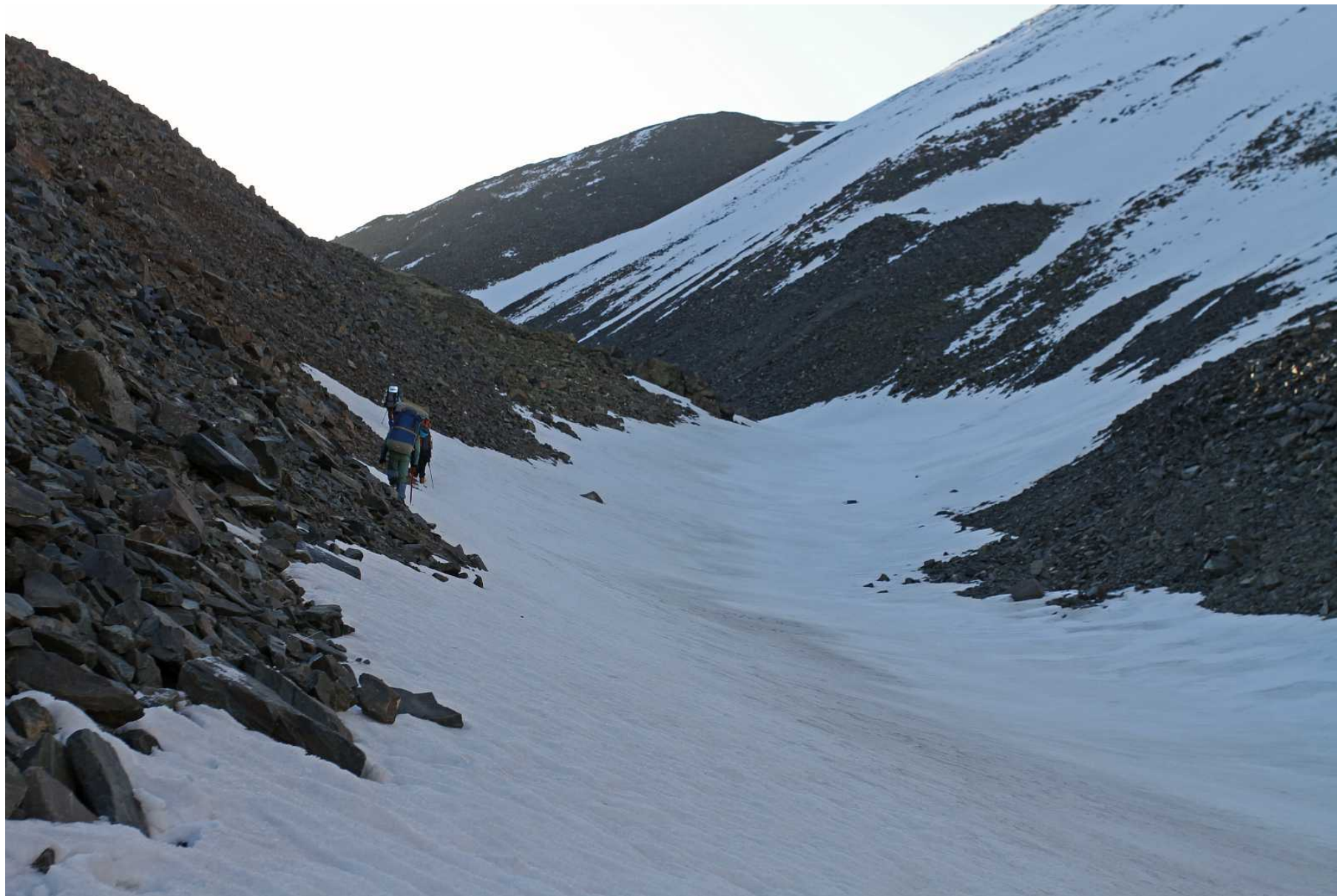
Фото 104. Вверх вдоль лога, ведущего в верховую долину перевала Рубцовский