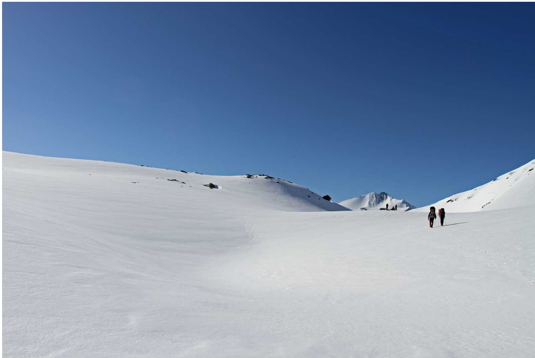
Фото 85. Выход на перевал Удачный