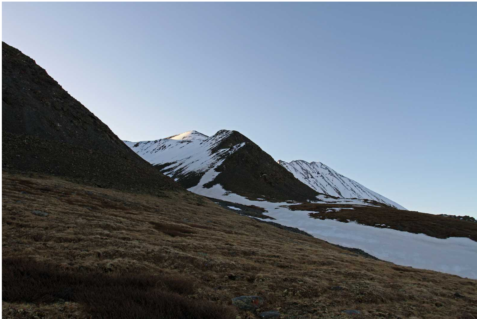
Фото 103. Вход в лог, выводящий в верховую долину перевала Рубцовский