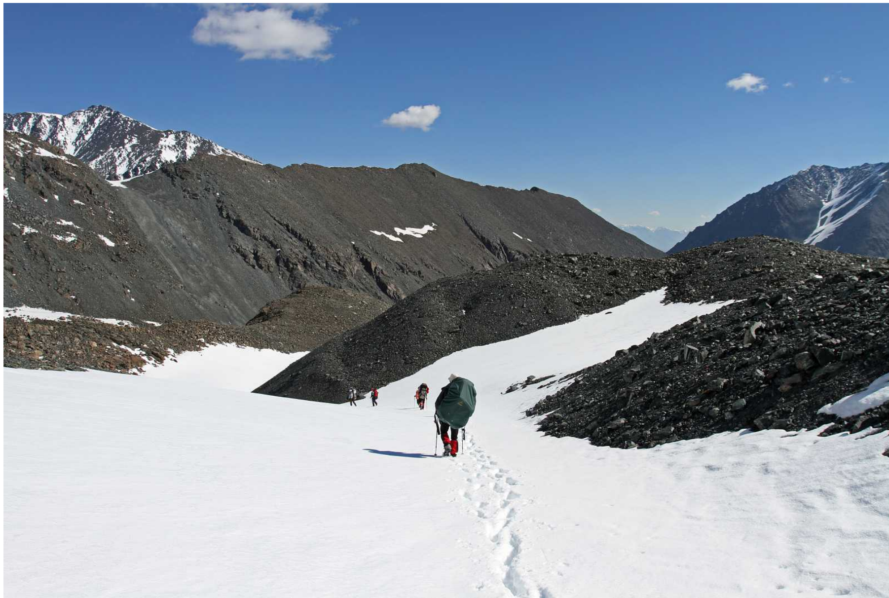
Фото 111. Спуск по заснеженным ложбинам морен к востоку от перевала Рубцовский