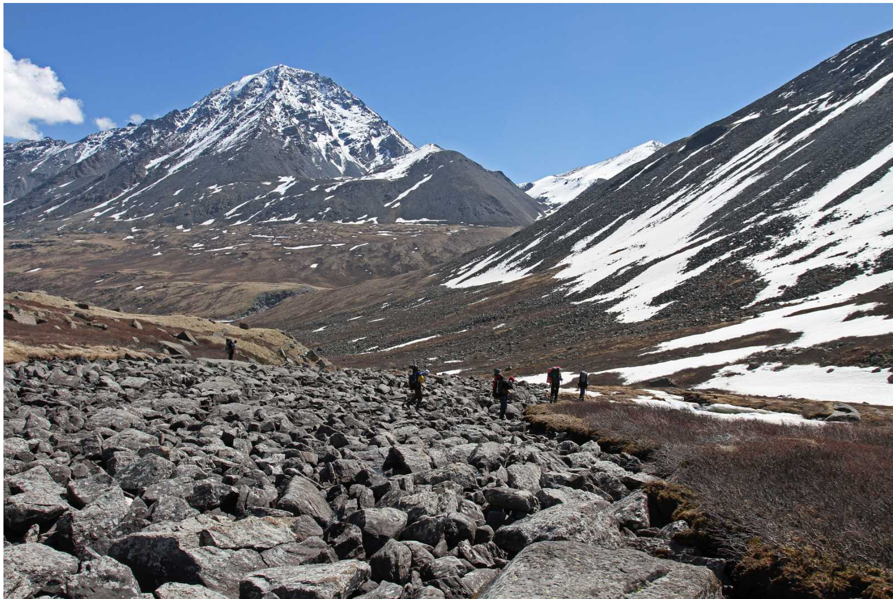
Фото 96. Спуск вдоль реки Караюк. Вода—под камнями