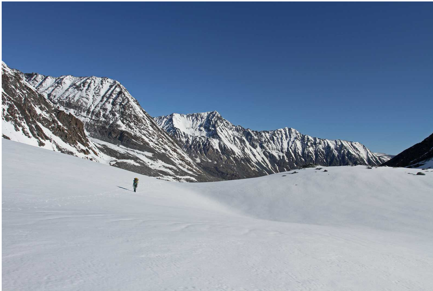
Фото 86. Выход на перевал Удачный. Вид назад, в сторону долины Аккол