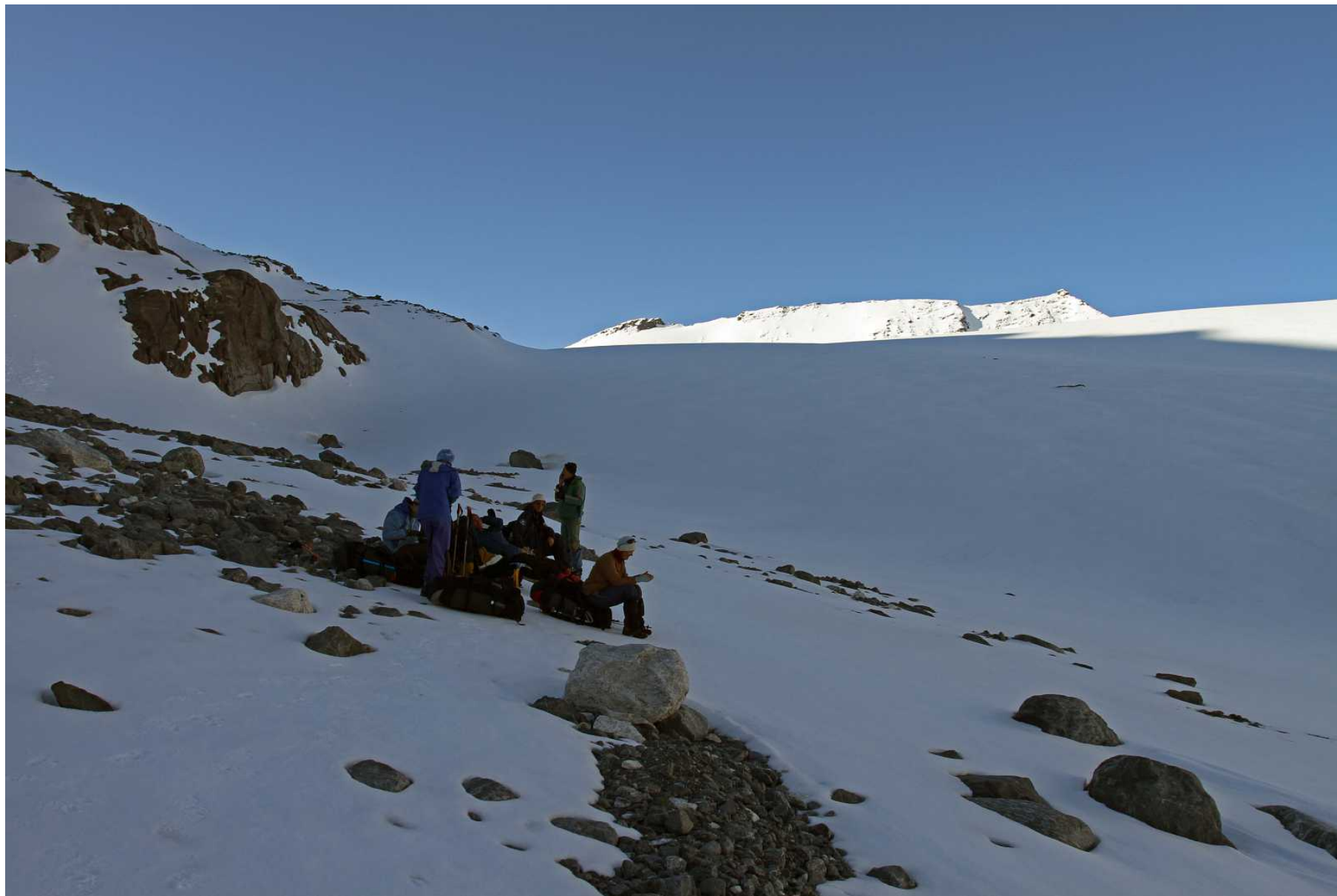
Фото 84. Перед выходом на ледник Удачный