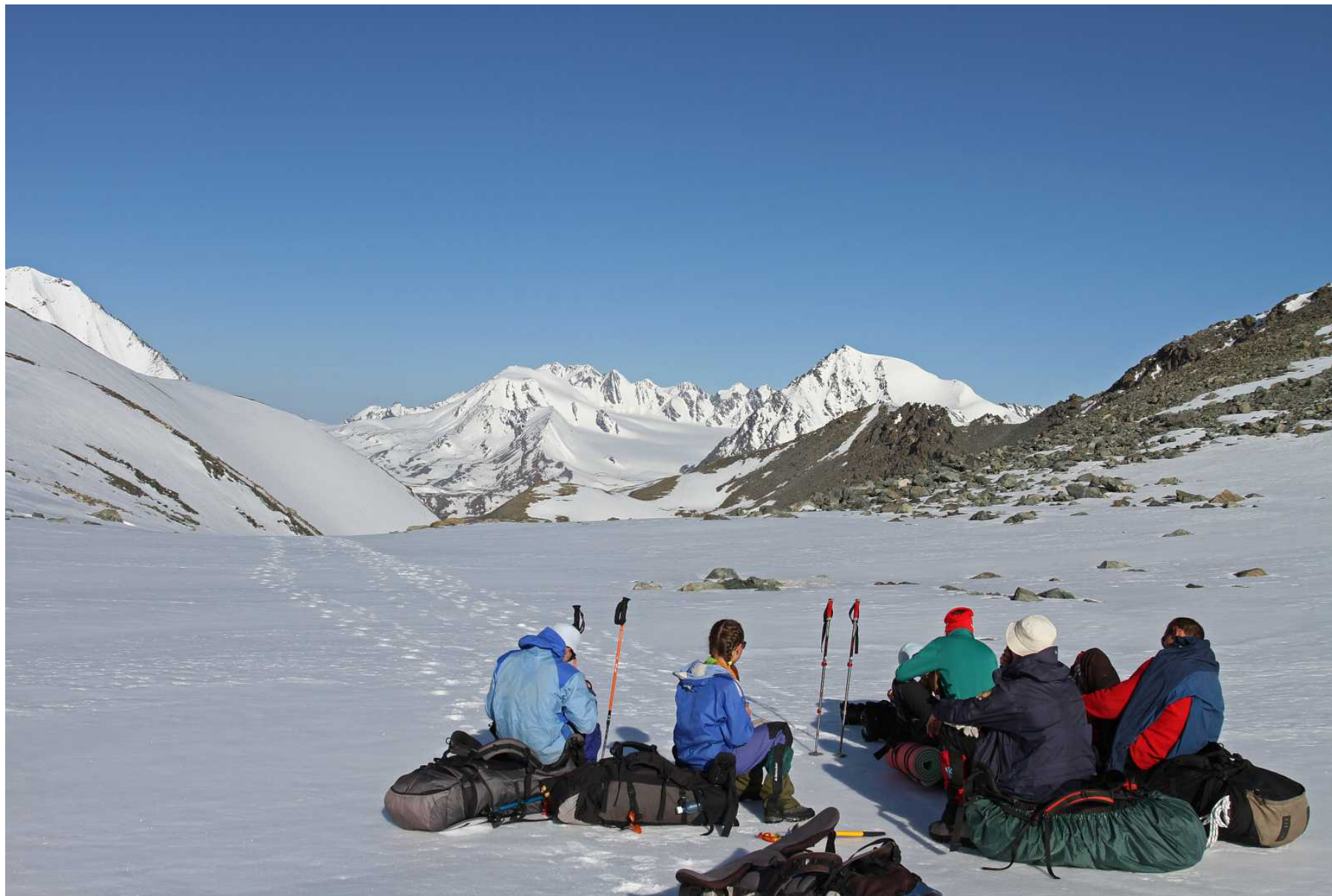
Фото 105. У нижнего края верховой долины перевала Рубцовский. Вид назад