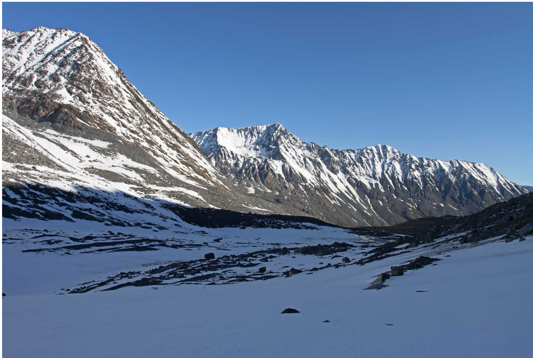
Фото 83. Разливы ('озеро') под северным языком ледника Удачный