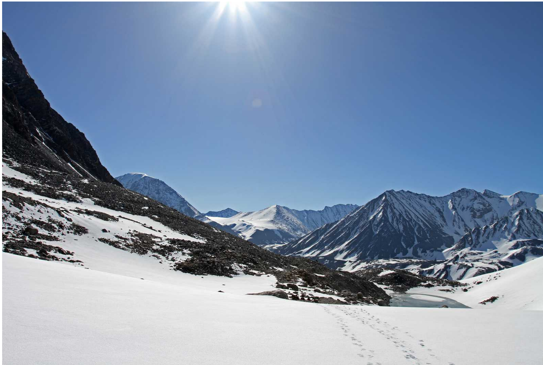
Фото 89. Выход к озеру у южного конца ледника Удачный