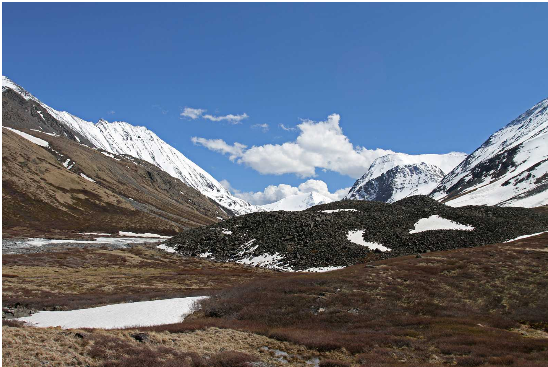
Фото 101. Вид вверх по долине Правый Караюк. Место стоянки – левее каменных завалов