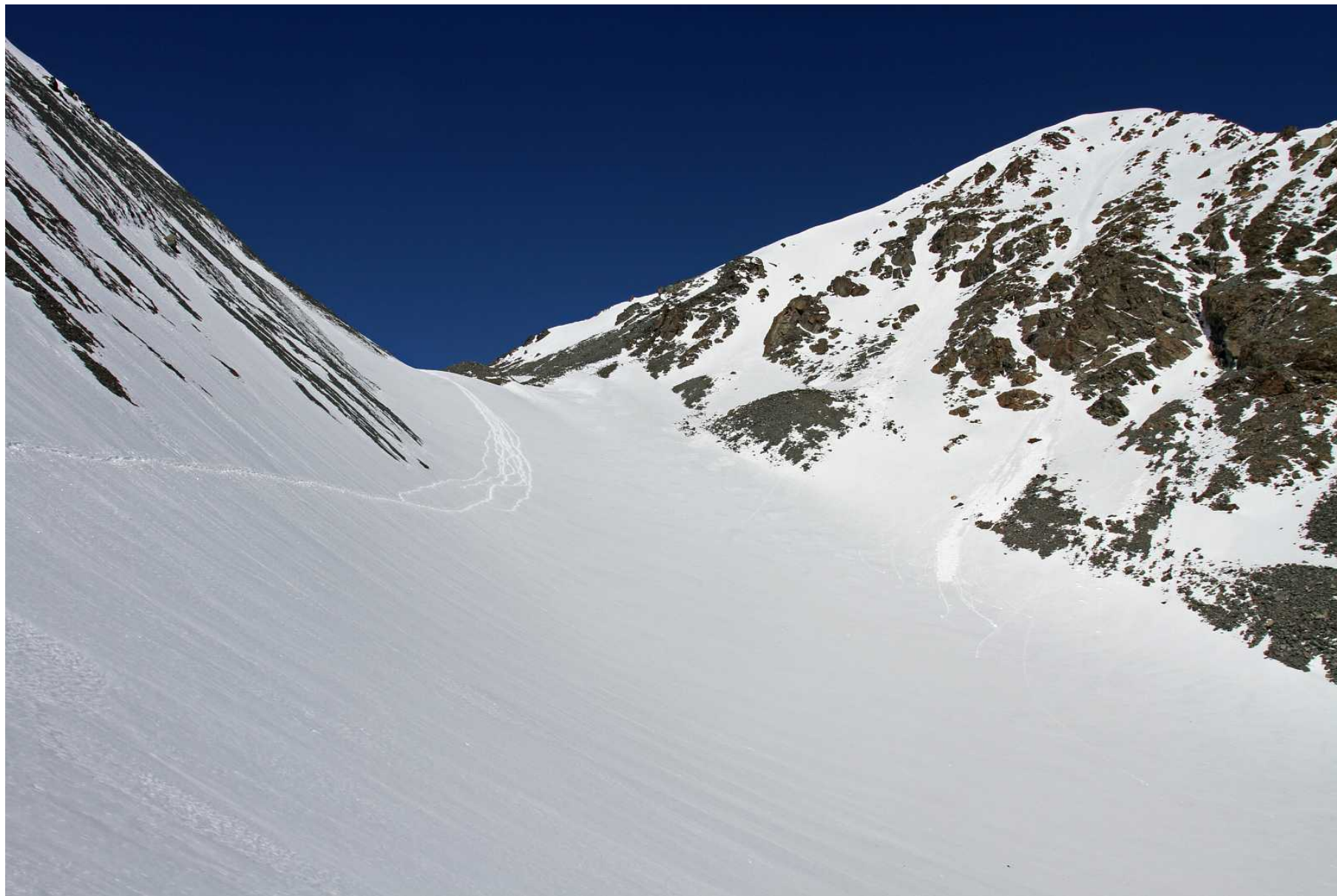
Фото 110. Вид назад, на путь спуска с перевала Рубцовский