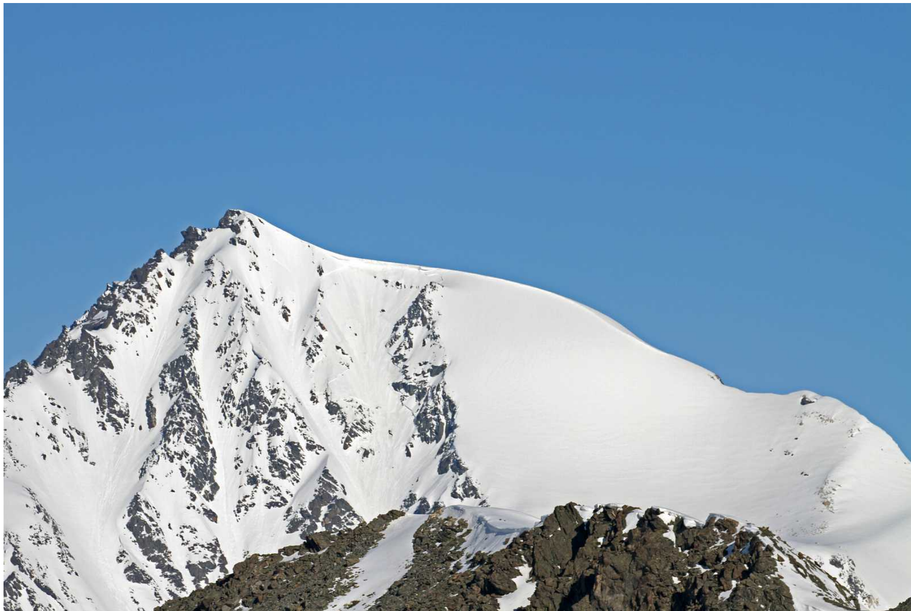
Фото 106. Вершина 3655.6 (теле). Вид из верховой долины на пути к перевалу Рубцовский