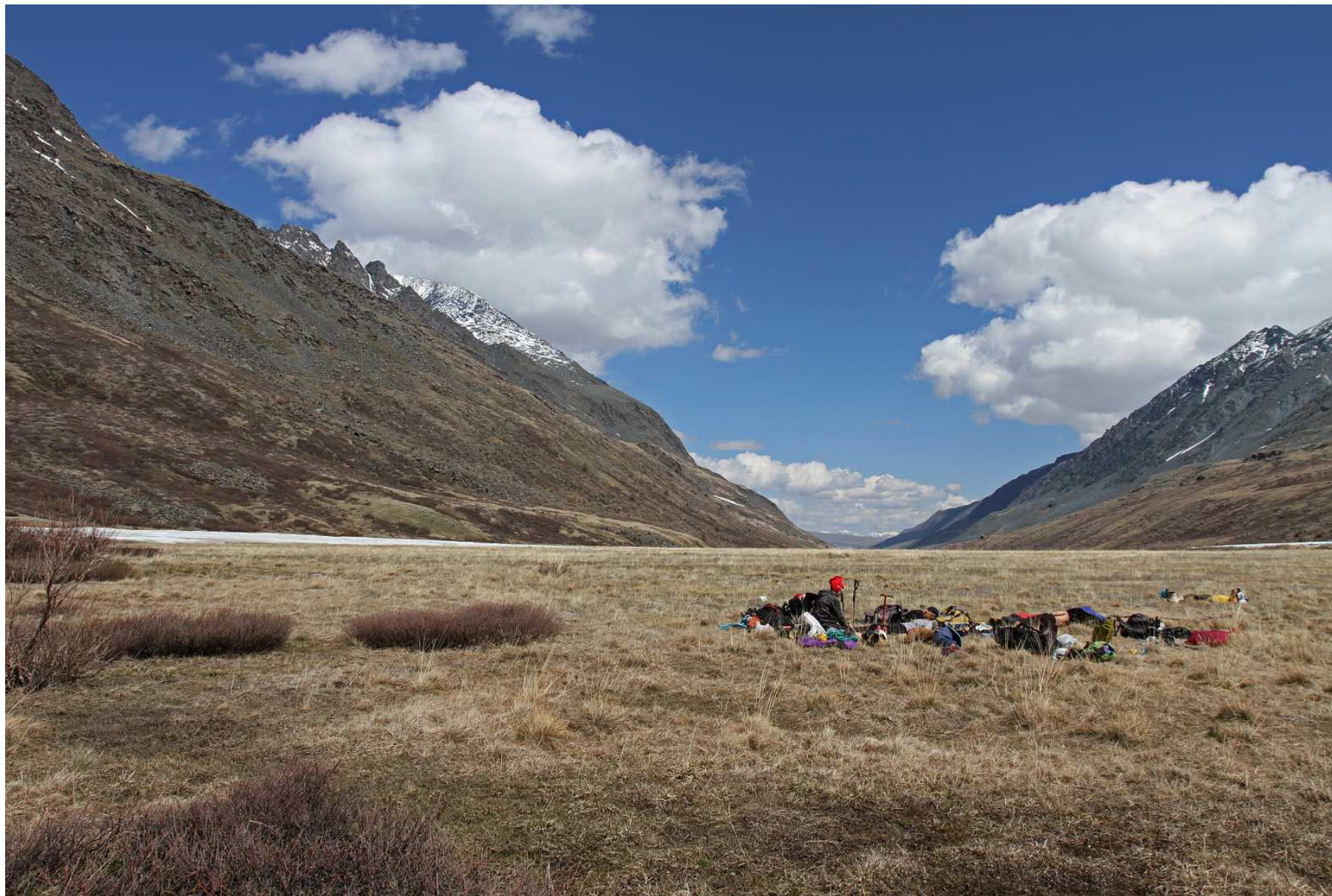
Фото 99. Обед близ слияния с речкой Правый Караюк, вид вниз по долине