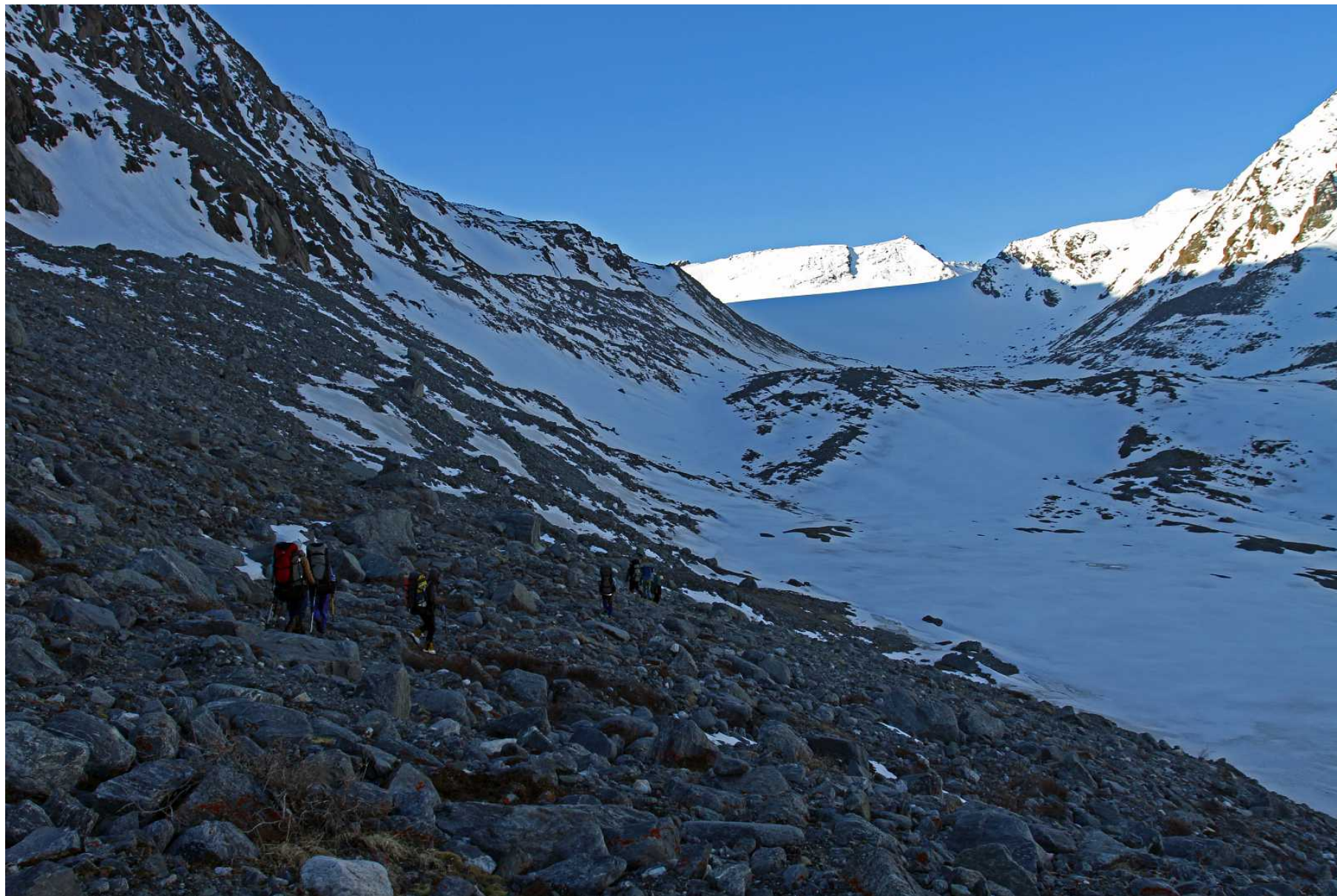
Фото 81. Путь по правым моренам к леднику Удачный