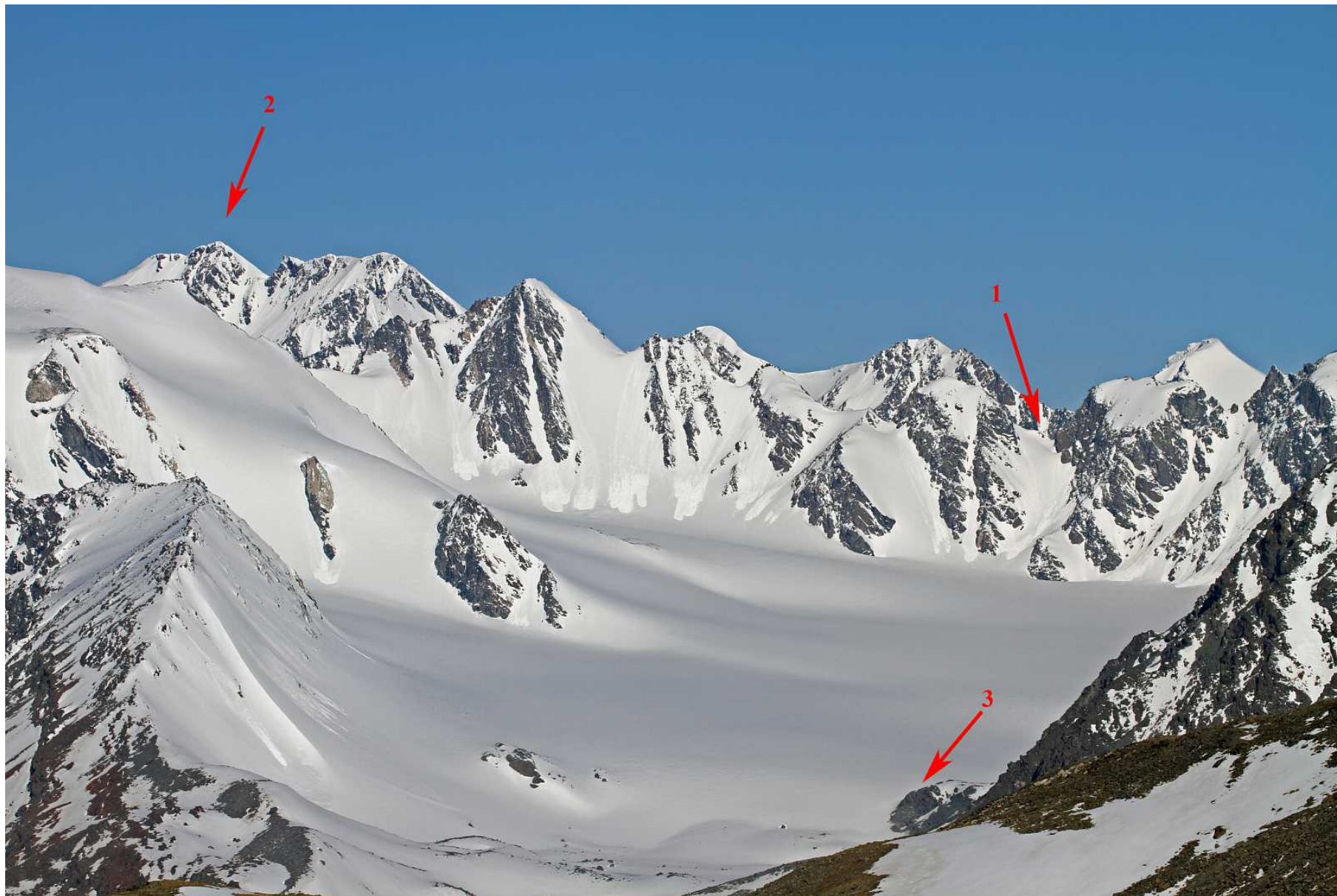
Фото 107. Вид на запад из верховой долины перевала Рубцовский. 1—перевал Солнечный, 2 – пик Чуйский, 3 – перевал Удачный