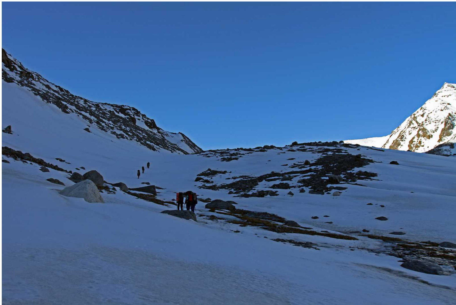
Фото 82. Подъём вдоль правого борта к леднику Удачный