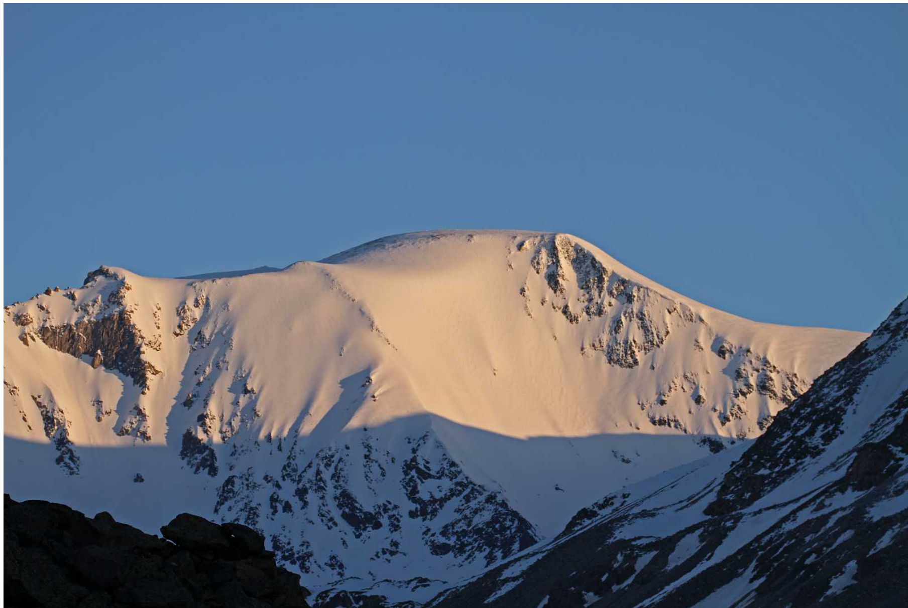
Фото 78. Вершина 3675.5 (теле). Вид от стоянки утром 12 июня