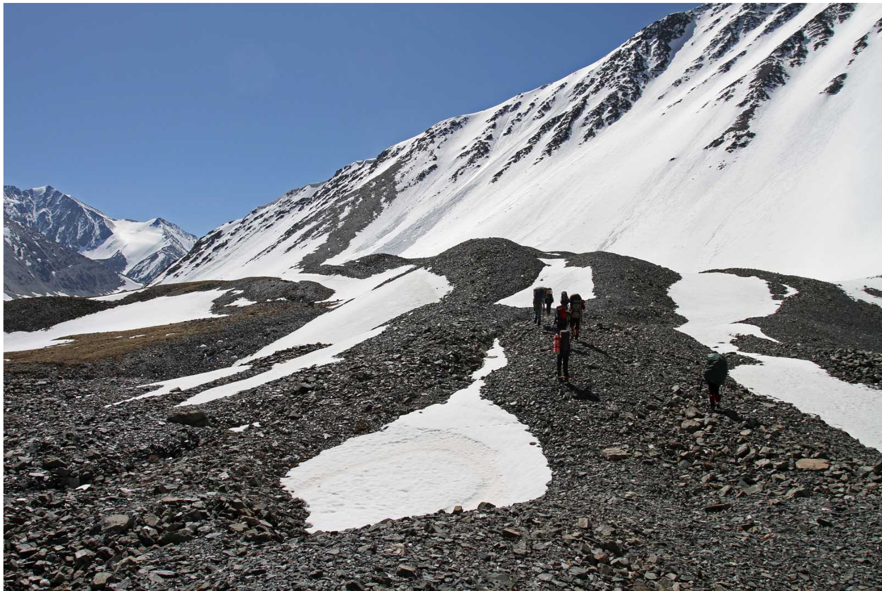
Фото 114. Путь по моренам вдоль правого борта. Слева впереди – вершина Ирбисту