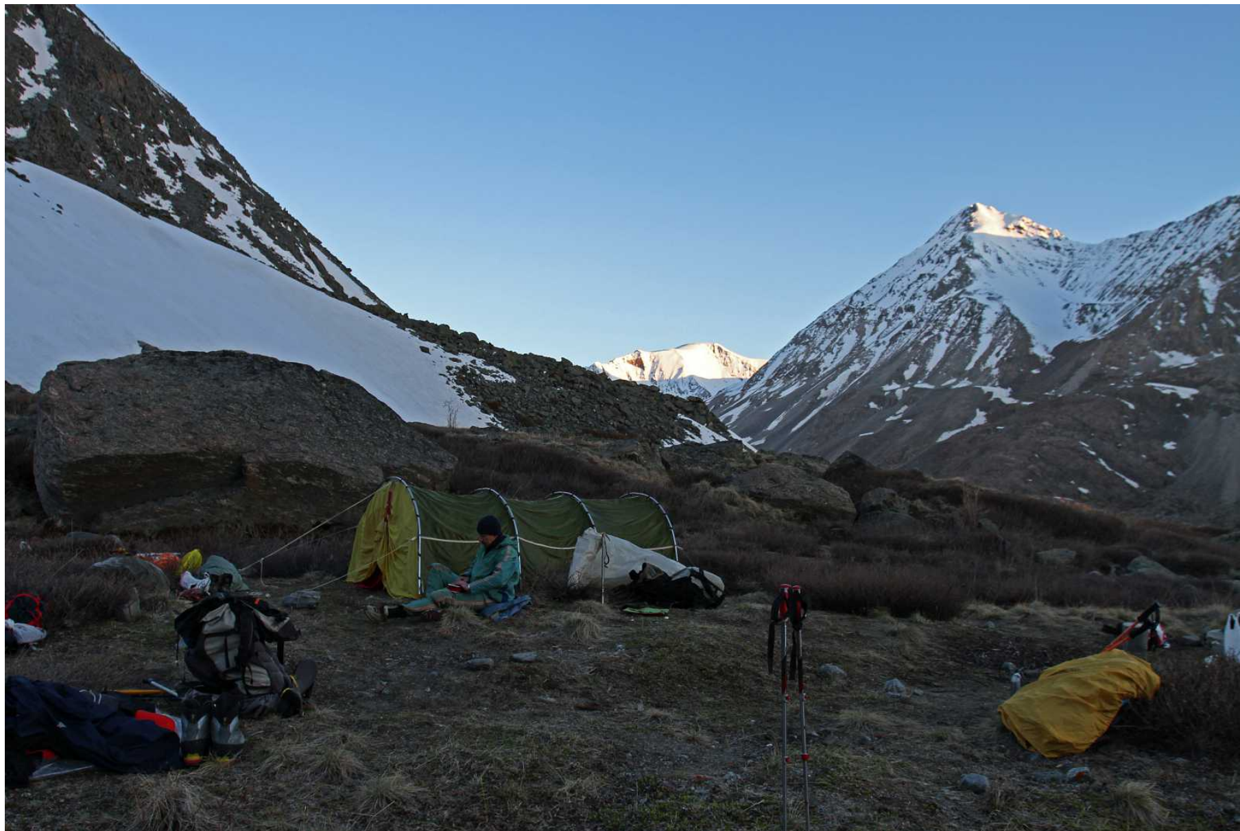
Фото 79. Утро 12 июня. Вид на запад, в сторону 3675.5