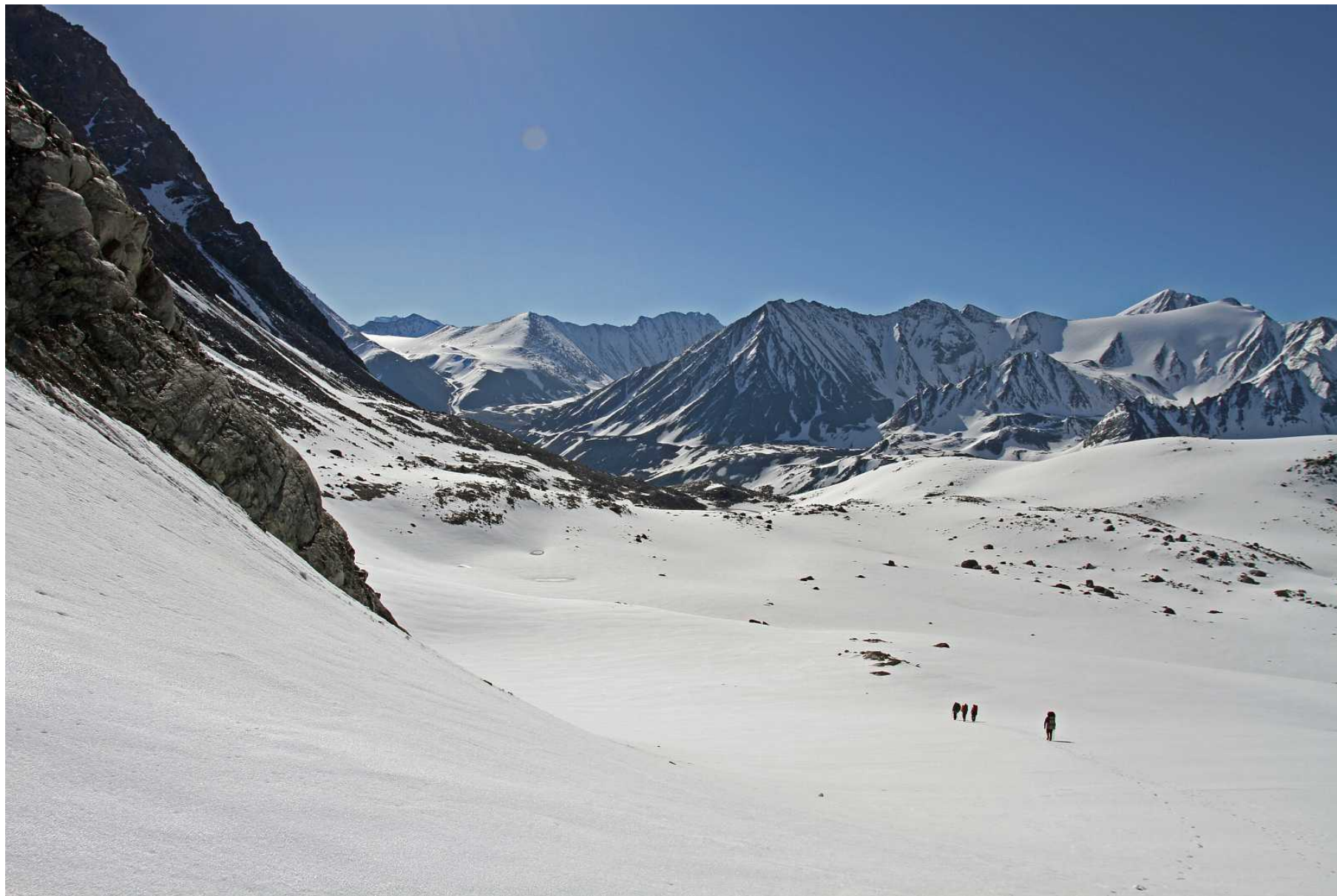
Фото 88. Спуск с перевала Удачный на юг