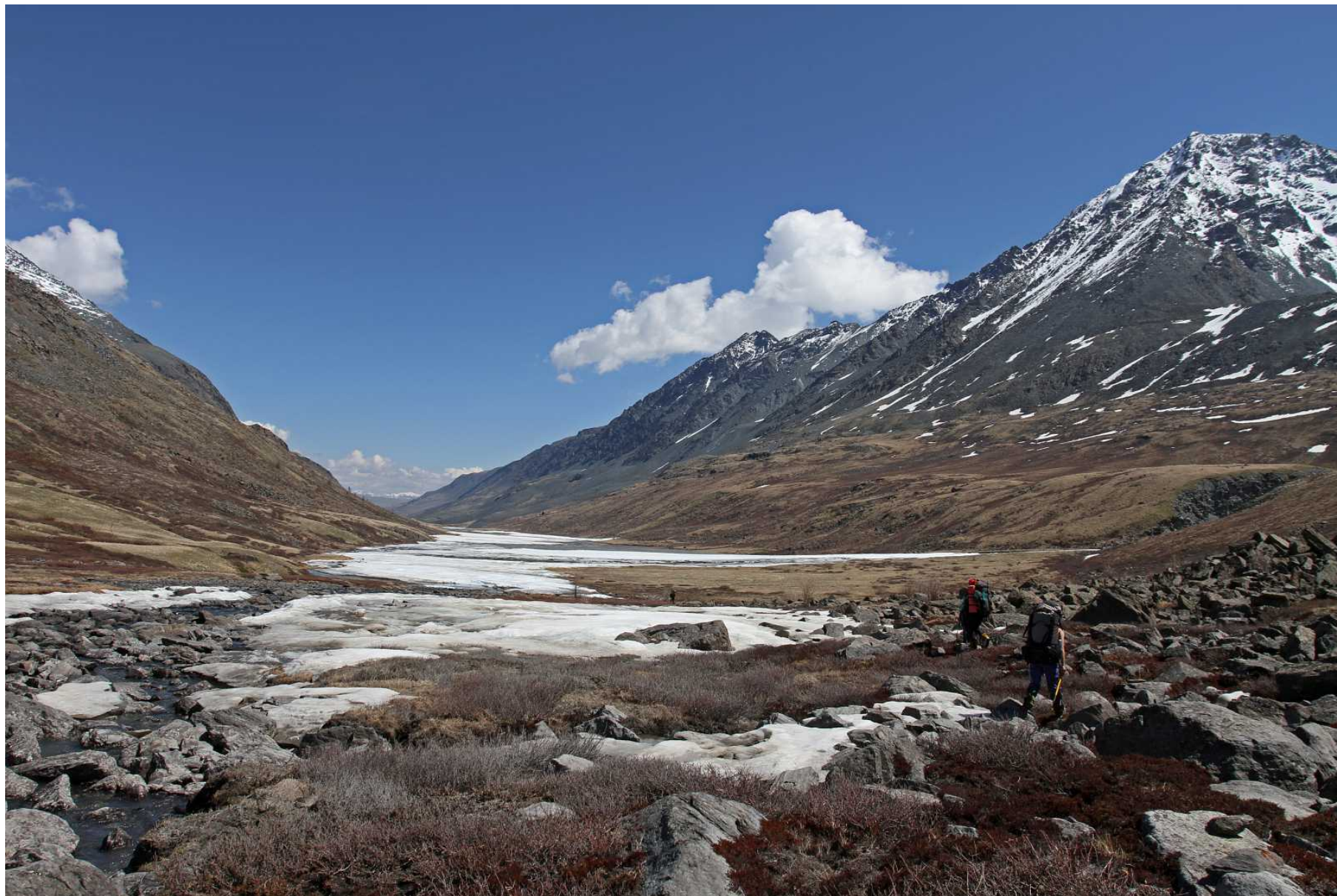
Фото 97. Выход к слиянию с речкой Правый Караюк