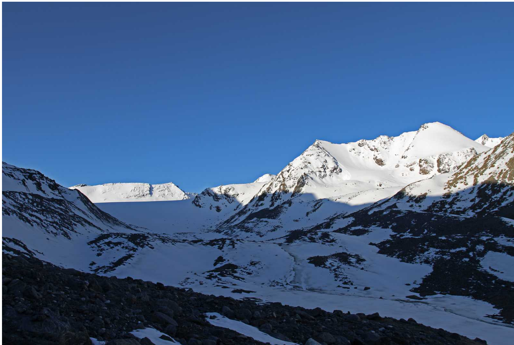
Фото 80. Заснеженные морены под концом ледника Удачный и левый борт его долины. Вид с правобережных морен над разливами