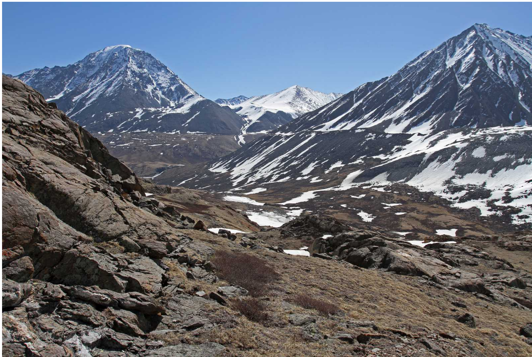
Фото 94. Спуск по ложбинам среди 'бараньих лбов' к реке Караюк