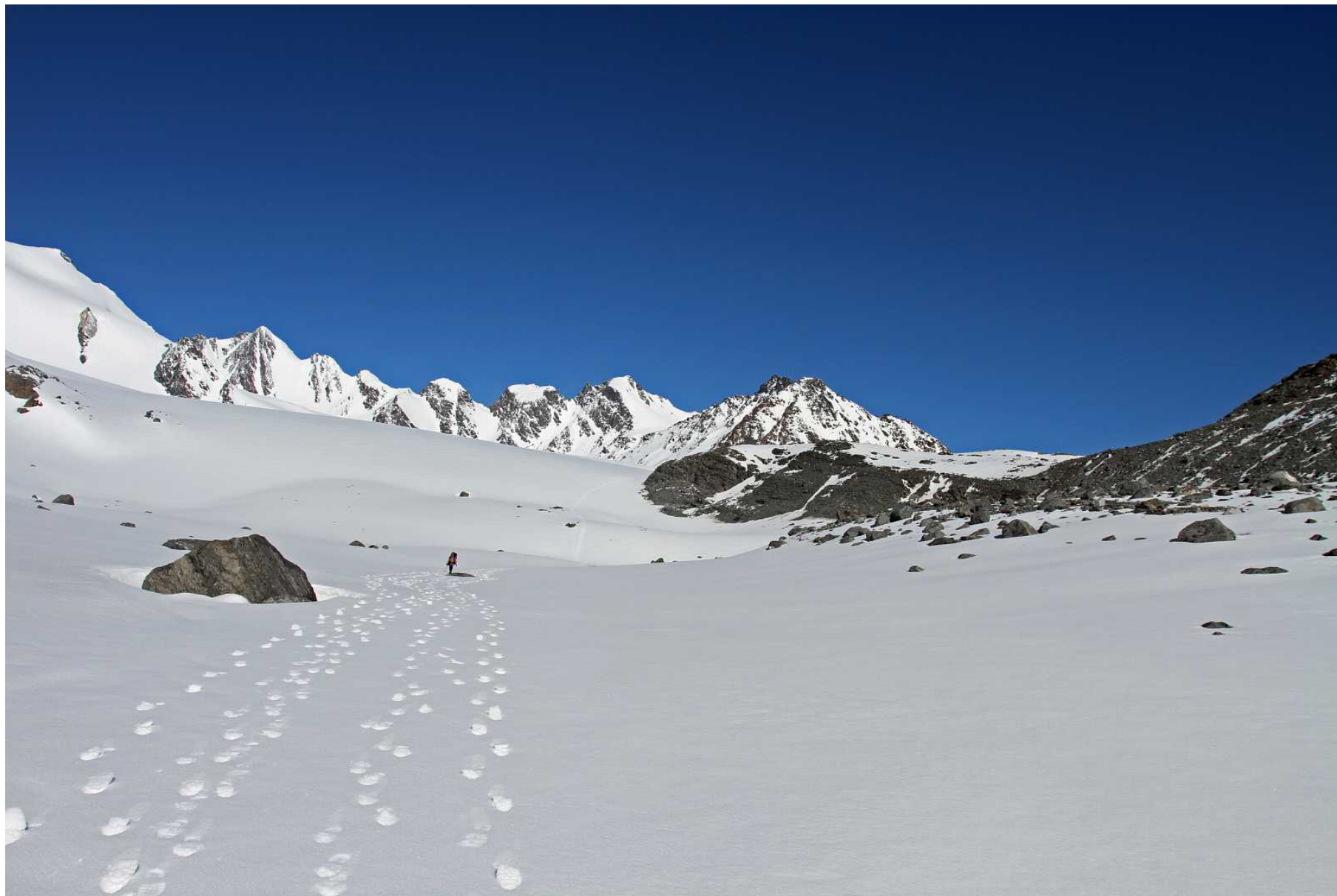
Фото 90. Вид назад, на путь спуска с перевала Удачный по леднику