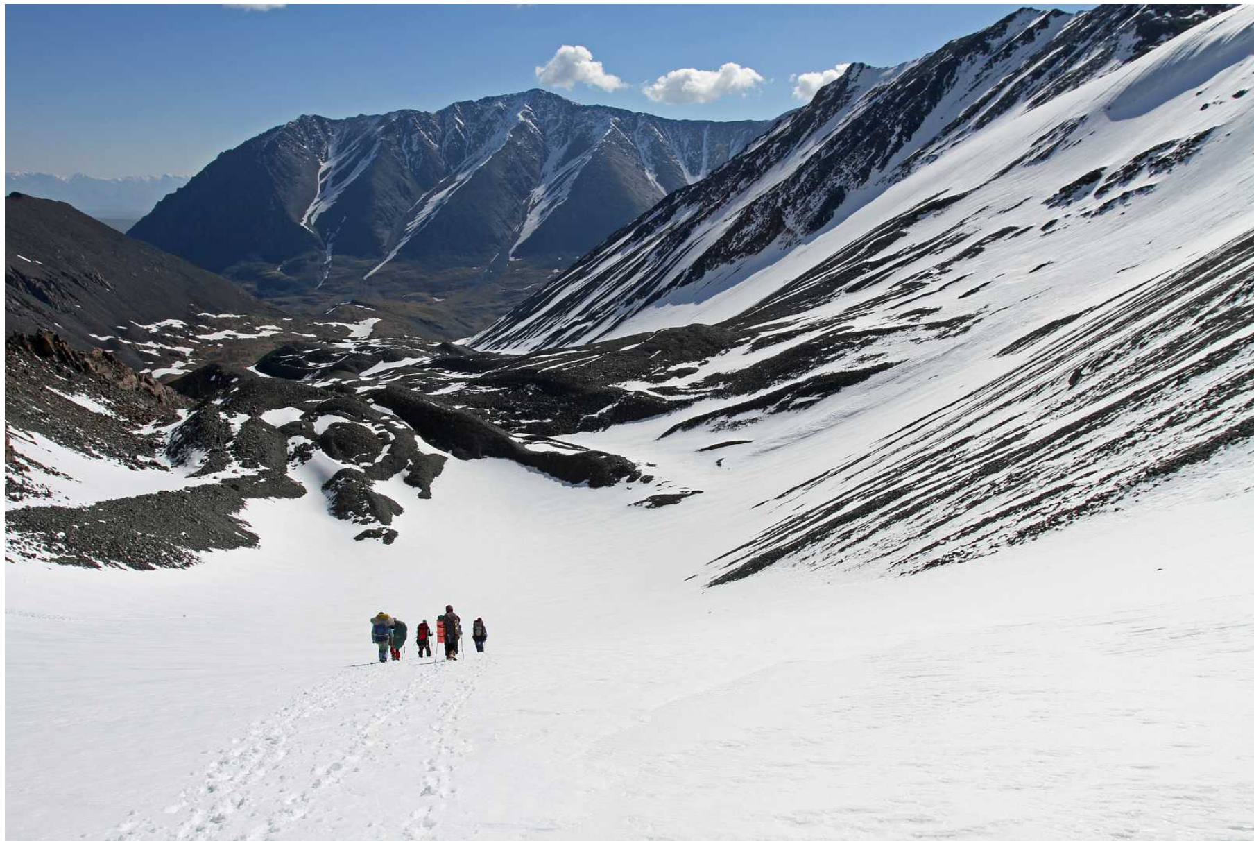
Фото 109. Начало спуска с перевала Рубцовский