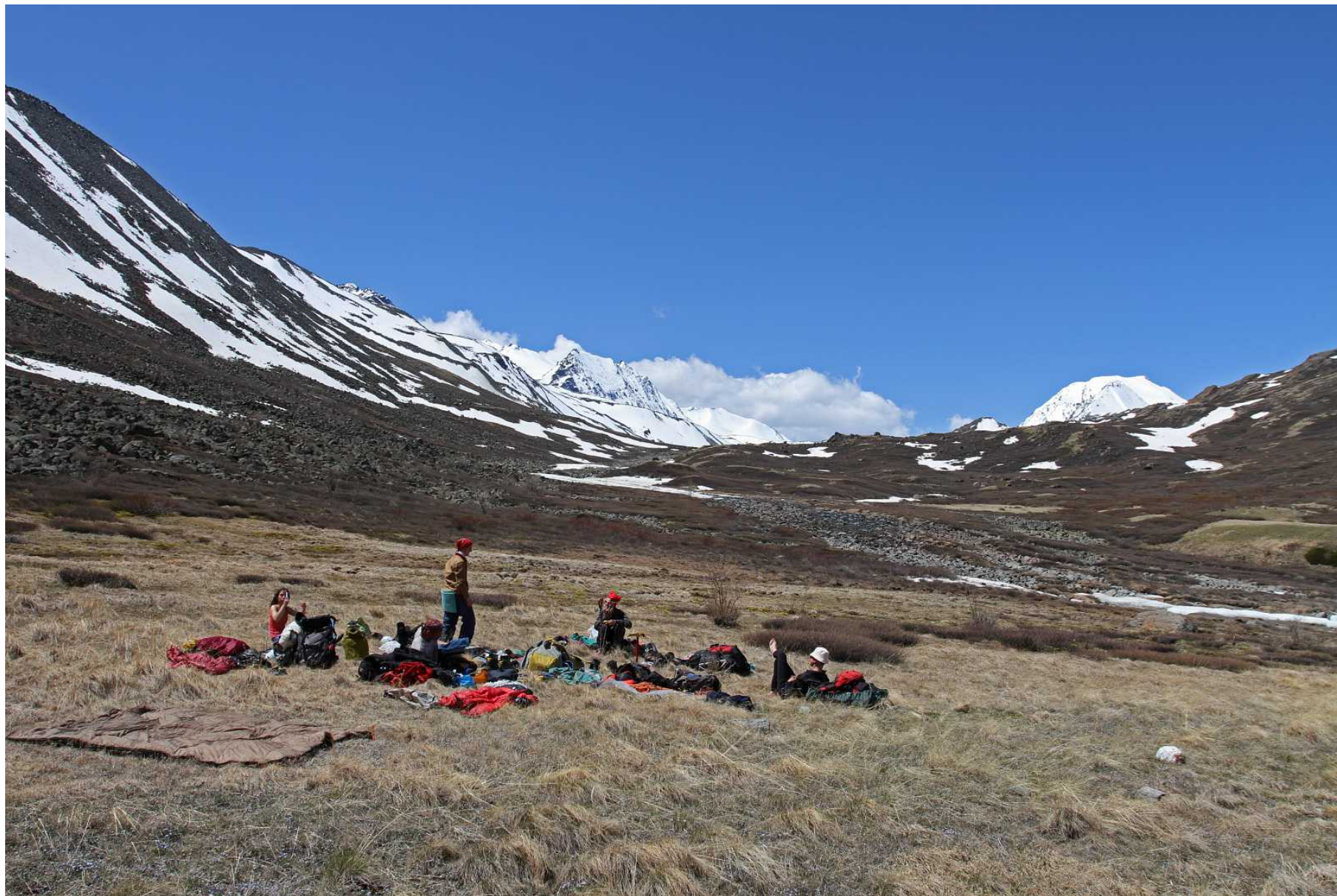
Фото 98. Обед близ слияния с речкой Правый Караюк, вид вверх по долине