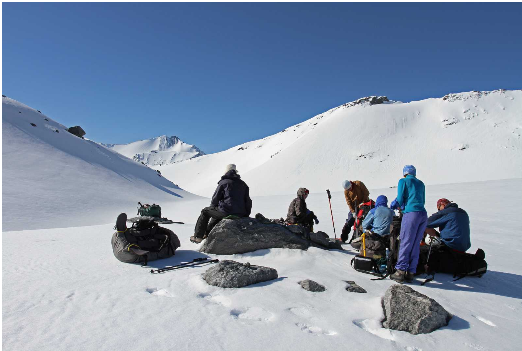
Фото 87. На перевале Удачный, вид в сторону спуска на юг