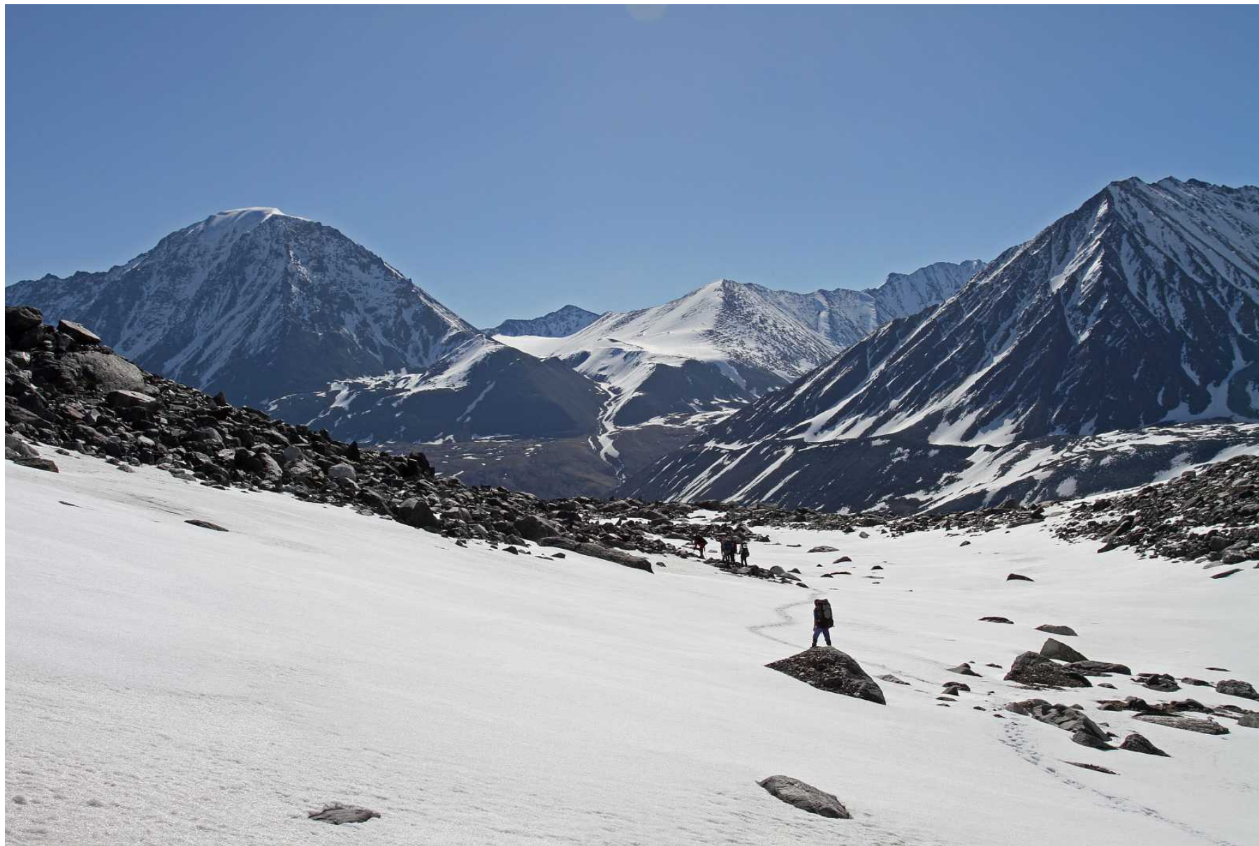
Фото 91. Спуск по заснеженным моренам в долину Караюк. Вершина Джаникту и верховая долина перевалов Рубцовский и Рублевского