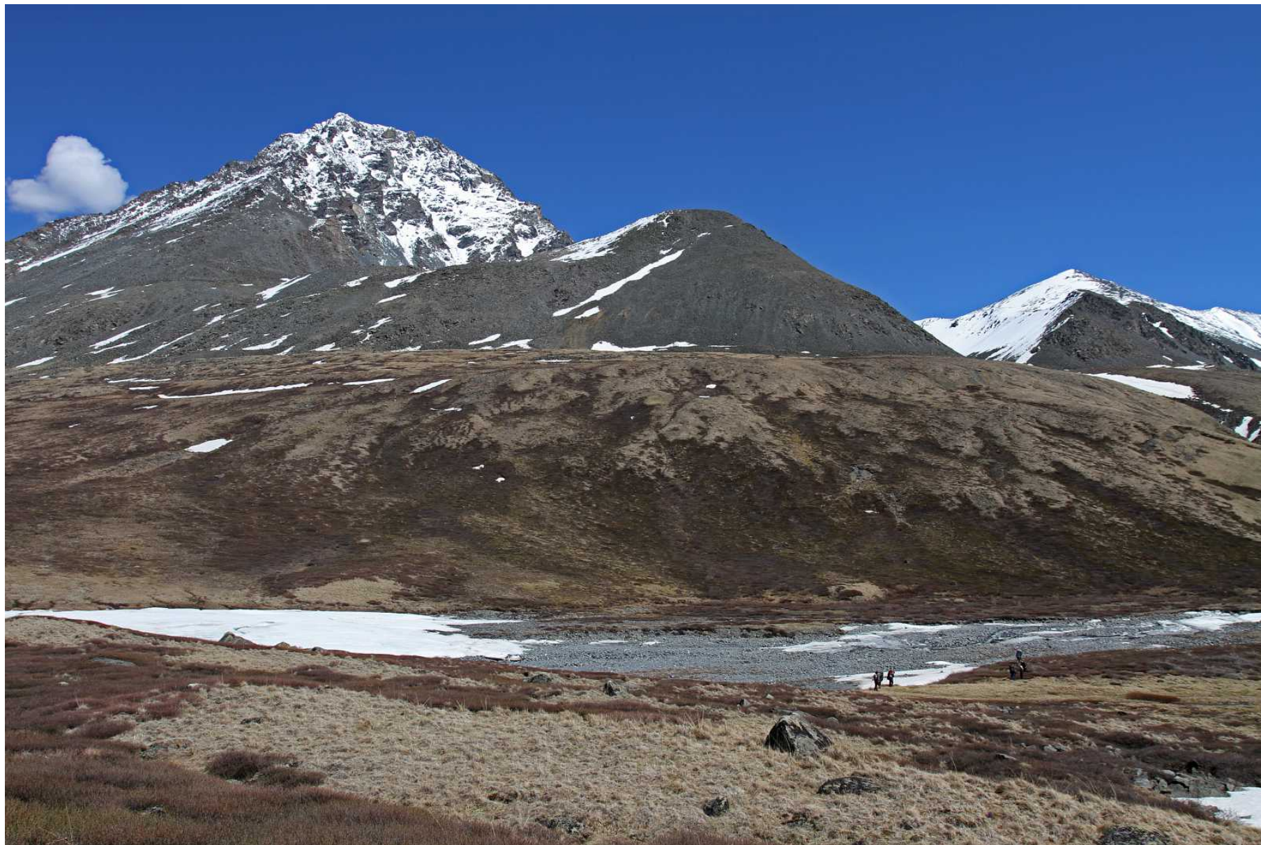
Фото 100. Выход к Правому Караююку. Впереди – путь к перевалу Рубцовский