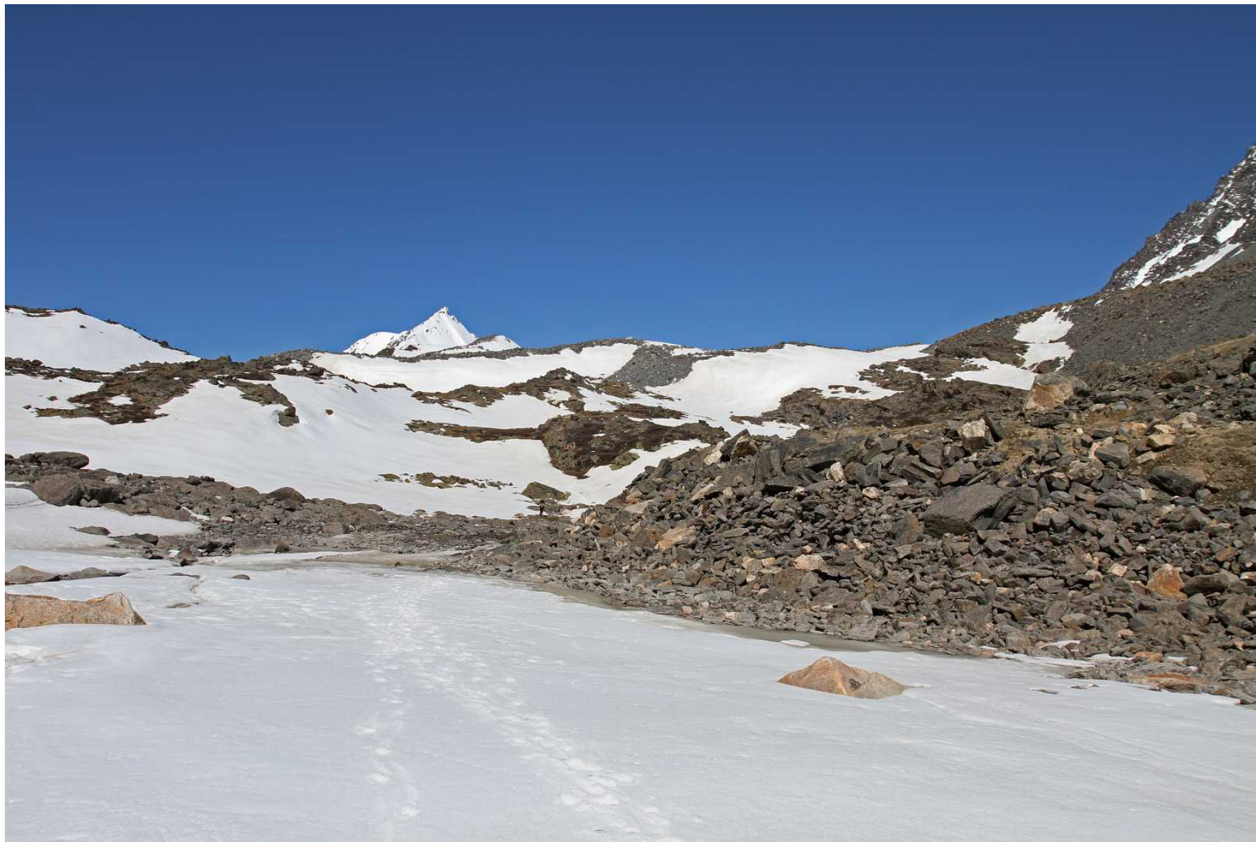
Фото 93. Вид назад на путь спуска по моренам ледника Удачный