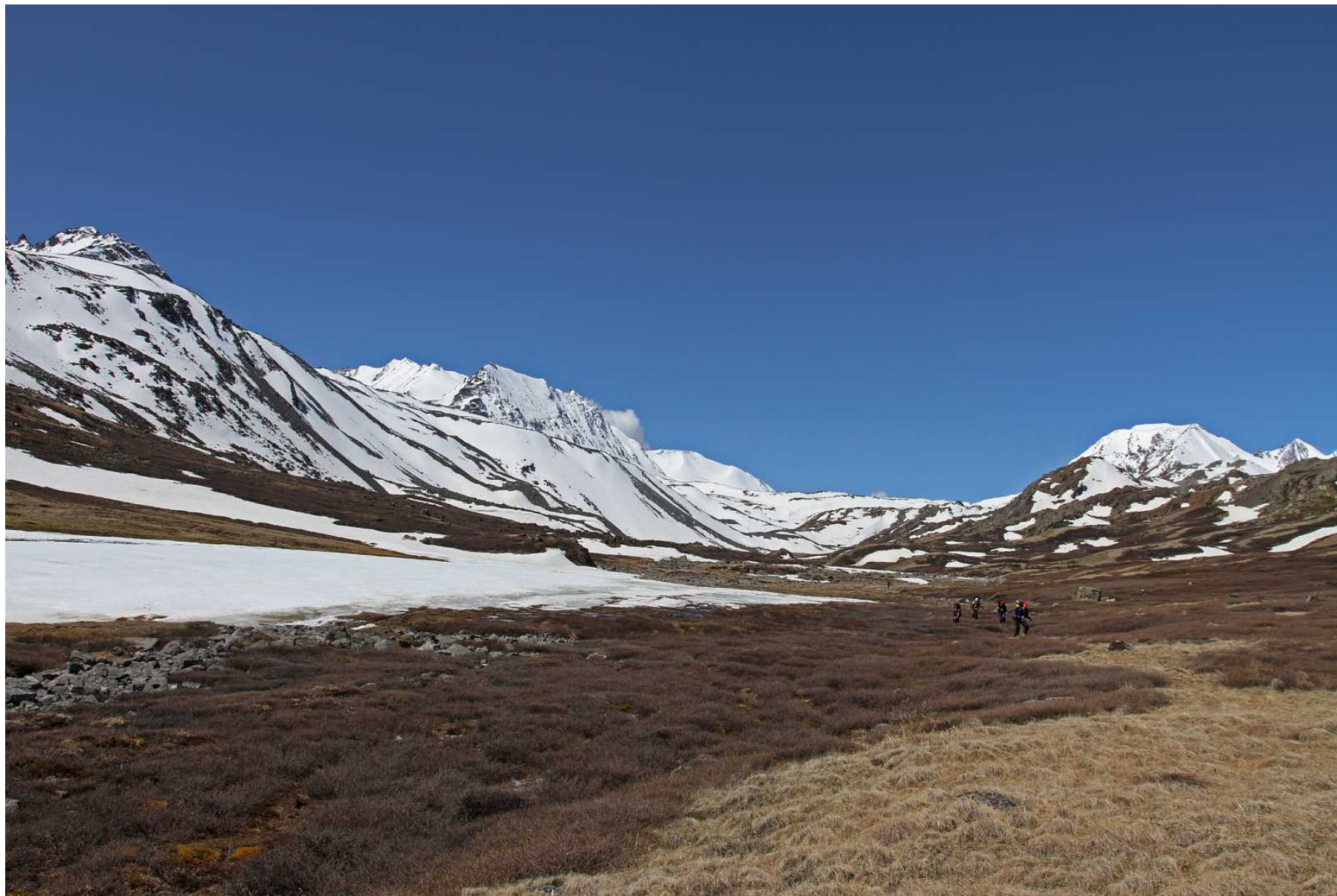
Фото 95. Верховья долины Караюк. К леднику Удачный – направо