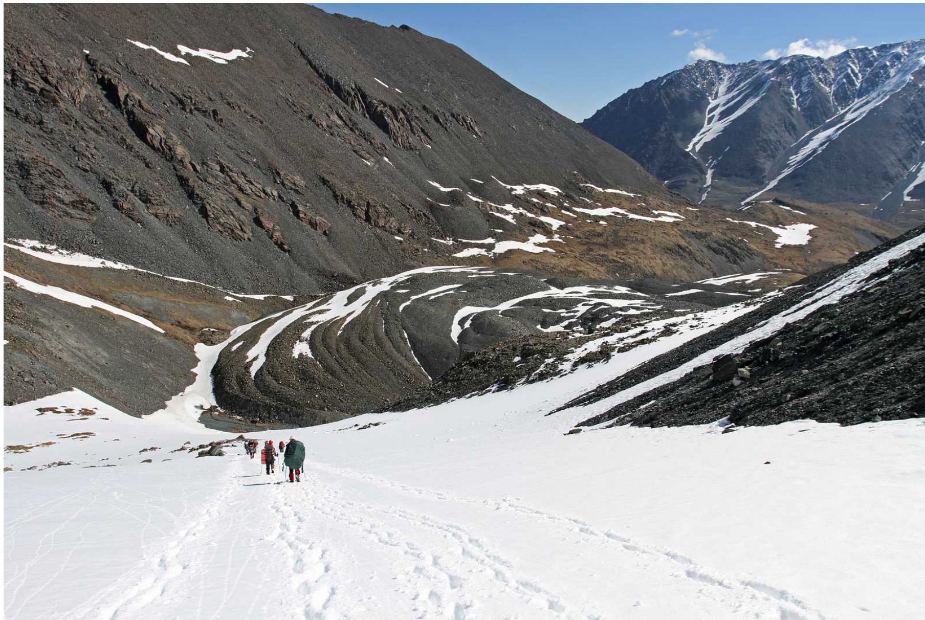
Фото 112. Спуск по моренам к востоку от перевала Рубцовский