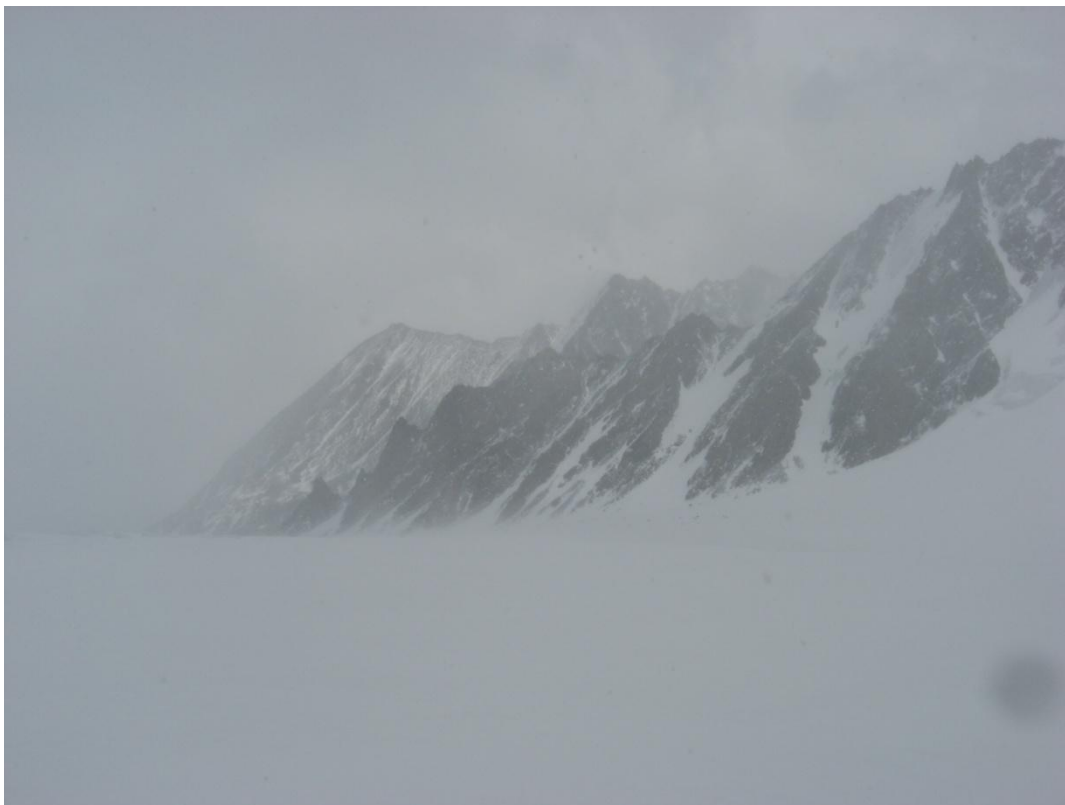
35. Распутывание трещин в ледниковом кармане лед. Софийский